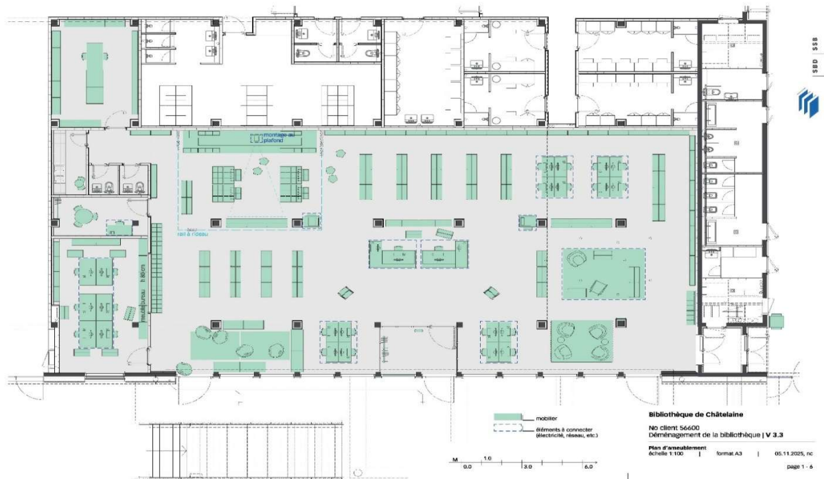
Concorde espace culture – Plan du rez-de-chaussée