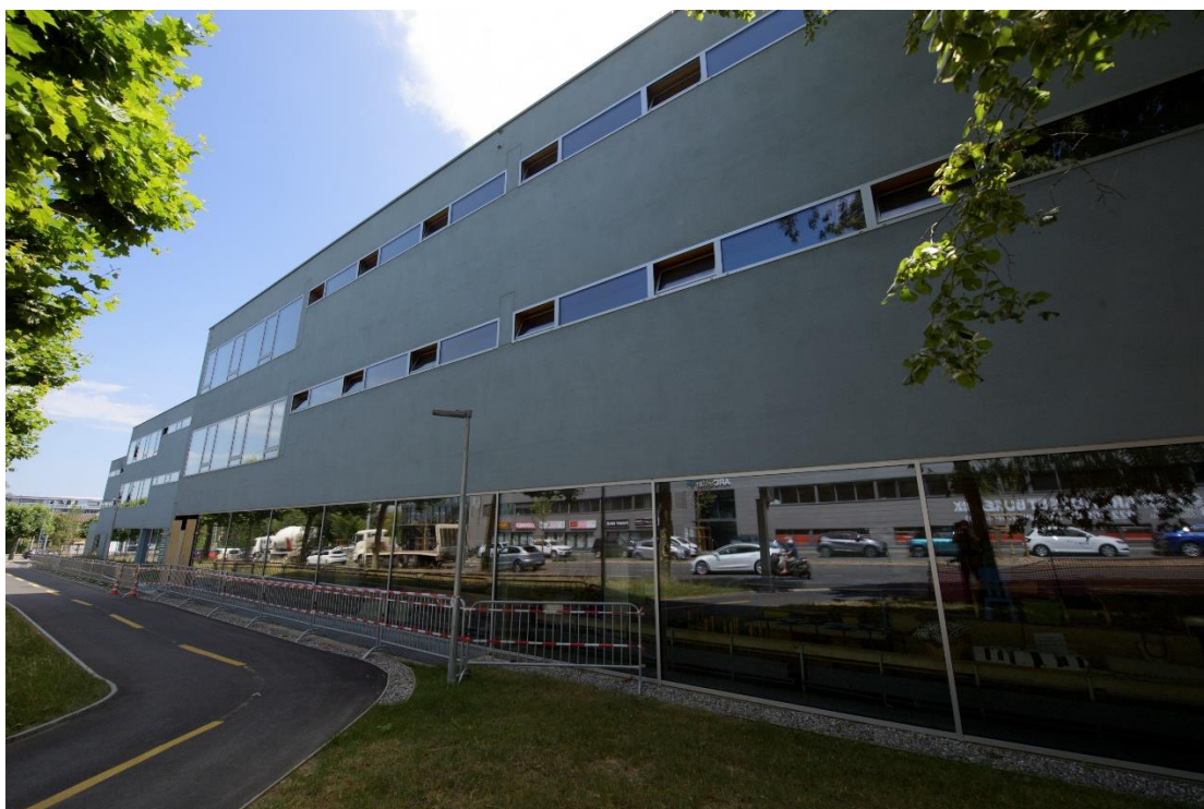
Façades côté Jura