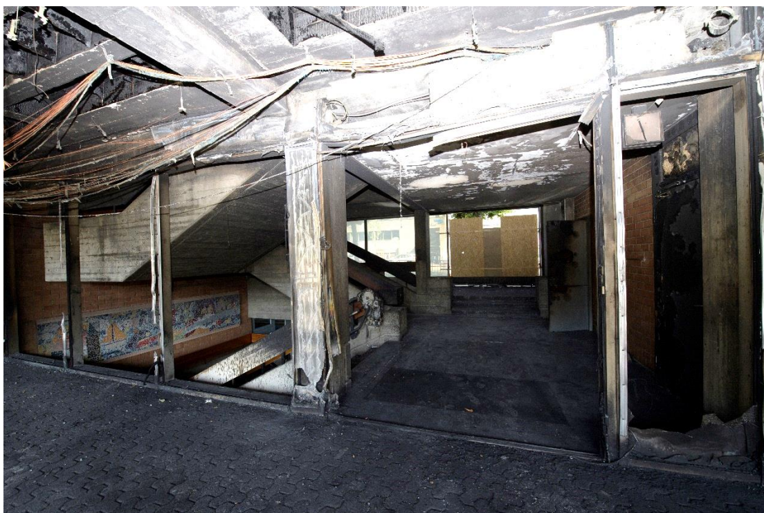
Préau couvert côté Salève