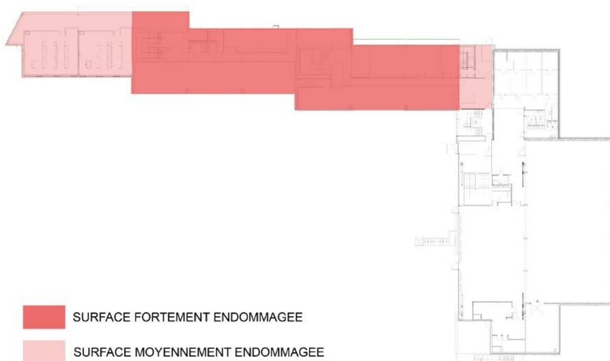
Plan de situation des zones touchées par le sinistre