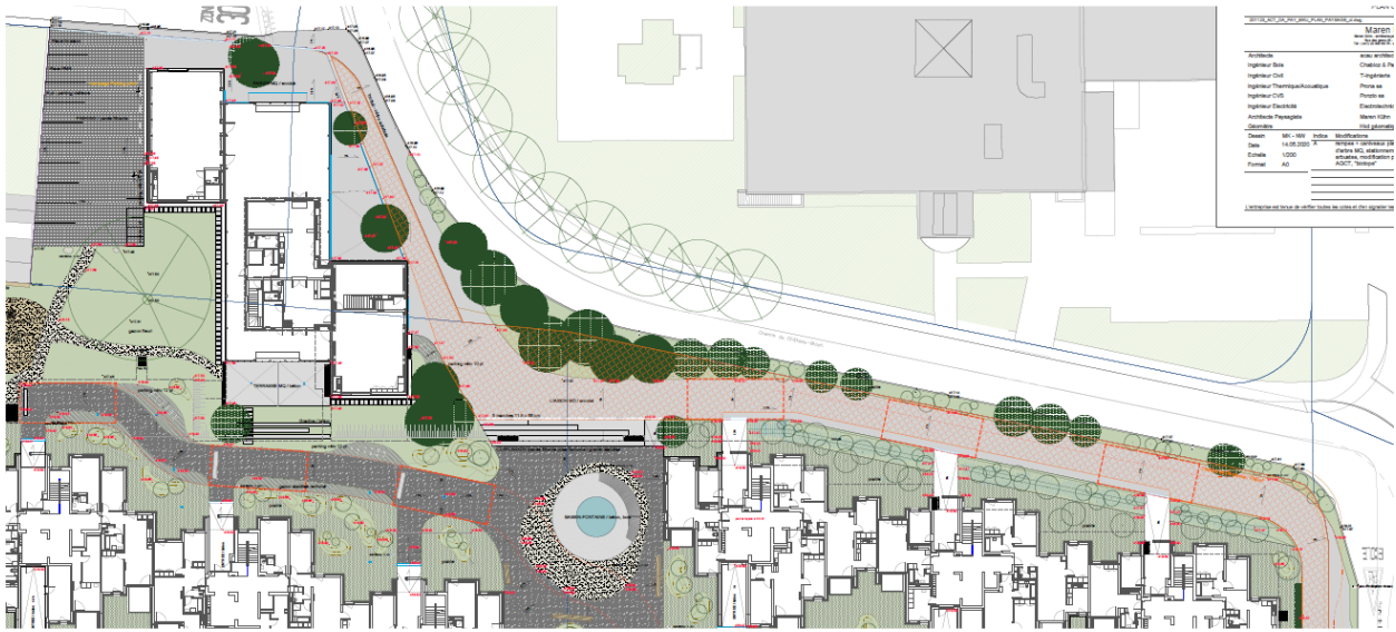
Figure 3 - Image directrice sur le chemin Château-Bloch issu du projet lauréat Actaris