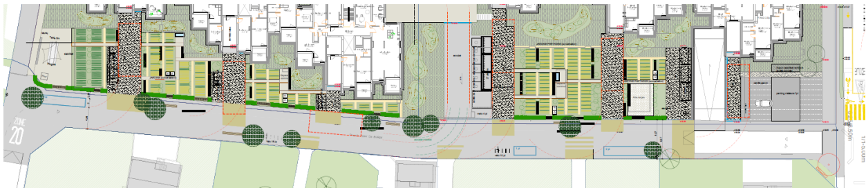
Figure 4 - Image directrice sur le chemin Henri-de-Buren

Afin d'assurer une cohérence avec les espaces publics projetés d'Actaris et de renforcer l'esprit de jardin-rue avec les jardins familiaux de part et d'autre du chemin Henri-De-Buren, la Ville de Vernier a lancé en 2018 une étude de faisabilité visant à requalifier le chemin Henri-de-Buren le long du projet Actaris. Cette étude a préconisé la mise en zone de rencontre de ce tronçon selon l'image ci-après :