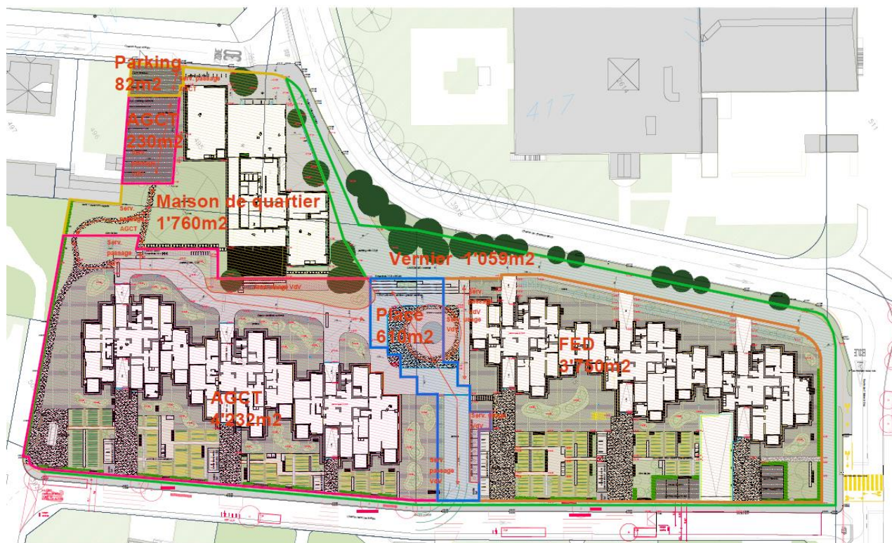
Figure 1 - Cession du projet Actaris au domaine public de la Ville de Vernier (zone verte)

Le projet Actaris prévoit également des cessions au domaine public, comme l'illustre la figure ci-après :