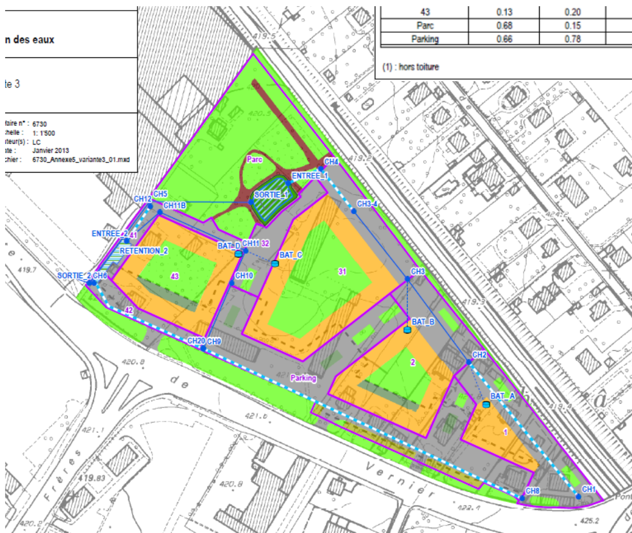
Figure 2. – Extrait du schéma directeur d'assainissement des eaux sur le PLQ – Collectif privé pour les eaux pluviales