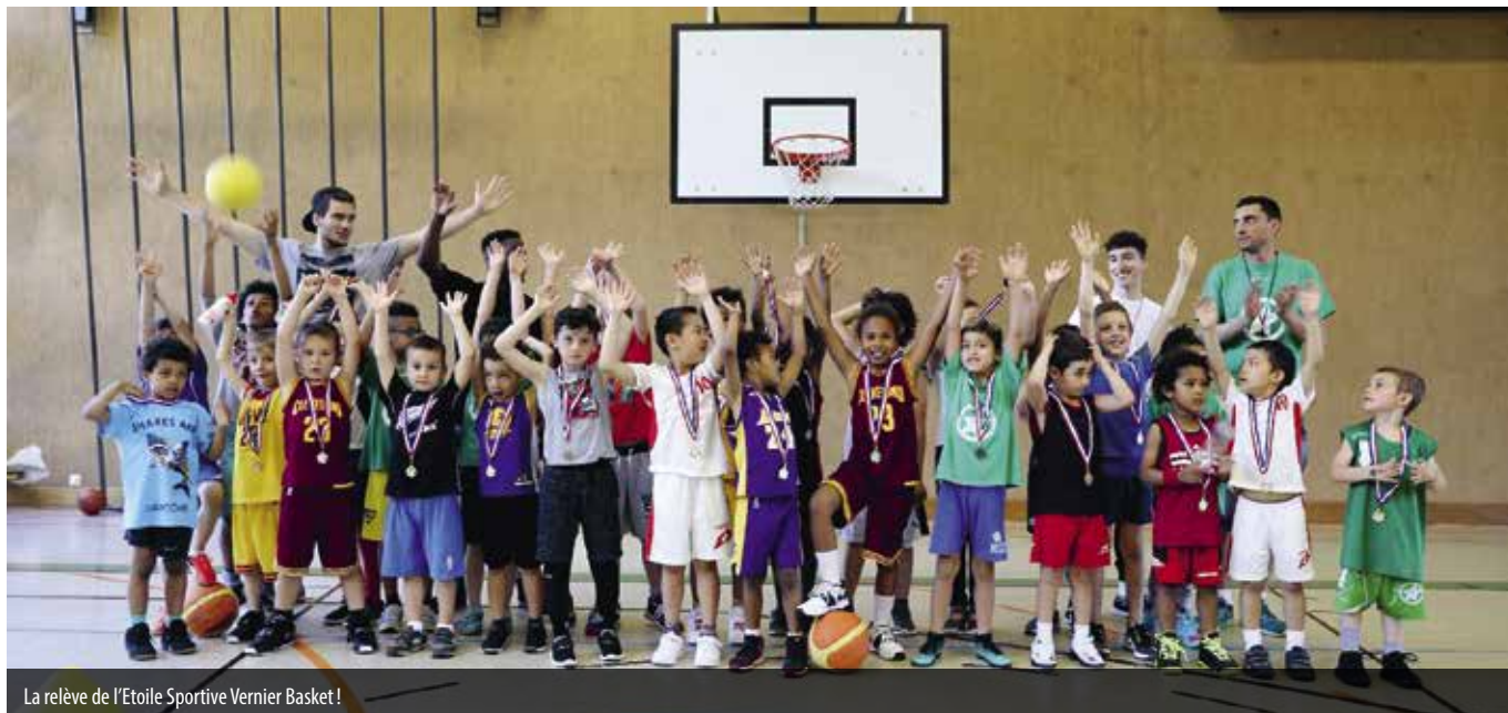
La relève de l'Etoile Sportive Vernier Basket!

Après des vacances bien méritées, les joueurs et joueuses de l'ESV basket sont de retour au travail!