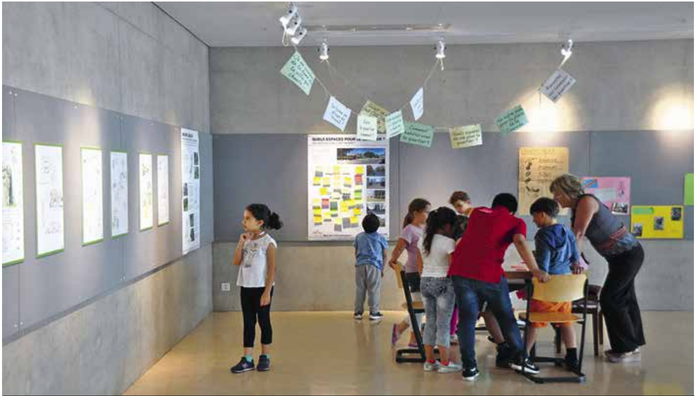
Exposition mobile pour retracer les avancées de l'étude Concorde / Libellules et réfléchir ensemble à la réalisation d'espaces de quartier conviviaux et de qualité.

immeuble de 45 logements ainsi qu'une crèche. Son ouverture est prévue dans un an et demi. Le long de l'avenue de l'Ain, 150 logements vont être mis sur le marché en deux étapes, auxquels vont s'ajouter 6000 m 2 de surfaces d'activités qui permettront de dynamiser le quartier, des projets qui devraient sortir de terre d'ici à 2022-2023.»