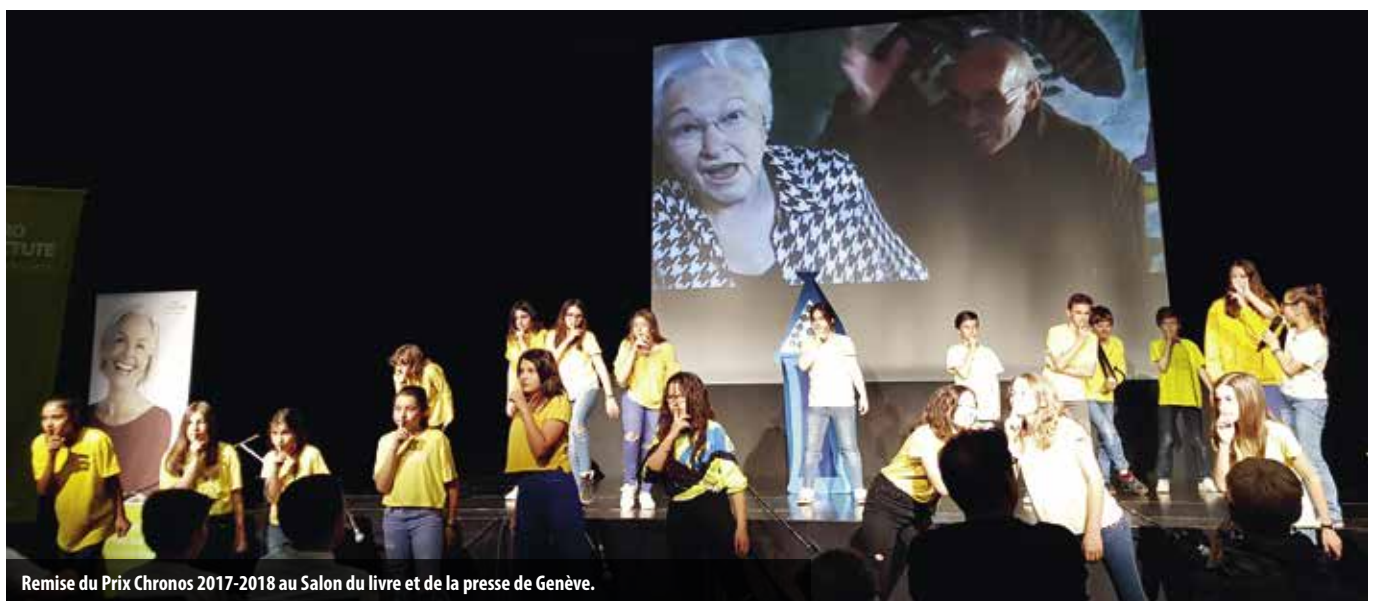
Remise du Prix Chronos 2017-2018 au Salon du livre et de la presse de Genève.

Service de la cohésion sociale Tél. 022 306 06 70, seniors@vernier.ch ou auprès des 3 bibliothèques municipales : Châtelaine : tél. 022 306 07 97 Vernier-Village : tél. 022 306 07 98 Avanchets : tél. 022 306 07 96