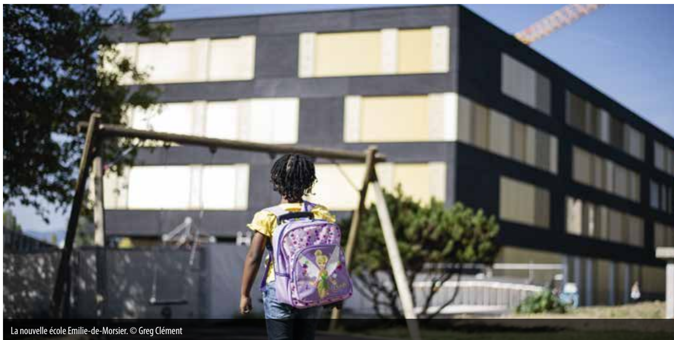
La nouvelle école Emilie-de-Morsier.

A la rentrée, l'école Emilie-de-Morsier, située au cœur de la Concorde à Châtelaine a accueilli ses premières classes. La mutation de ce quartier avance à grands pas, deux nouveaux immeubles viennent de se construire et deux autres vont bientôt voir le jour.