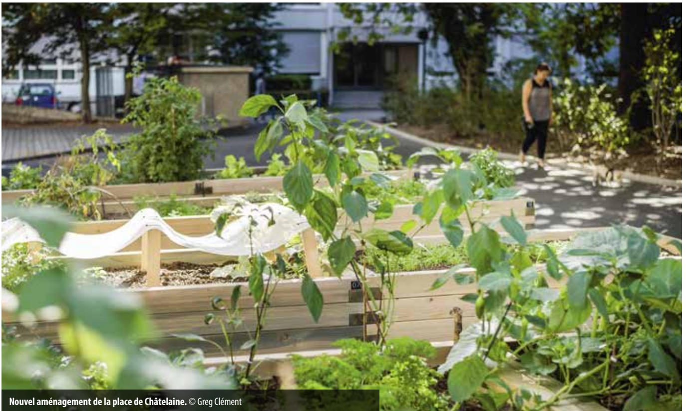
Nouvel aménagement de la place de Châtelaine.