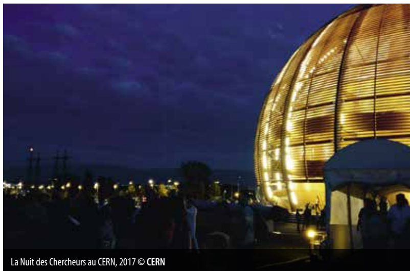
La Nuit des Chercheurs au CERN, 2017

Vous ne pouvez pas vous déplacer? Suivez cet événement en direct sur Facebook Live et posez toutes vos questions! Des chercheurs du CERN vous feront découvrir les facettes les plus surprenantes de la soirée.