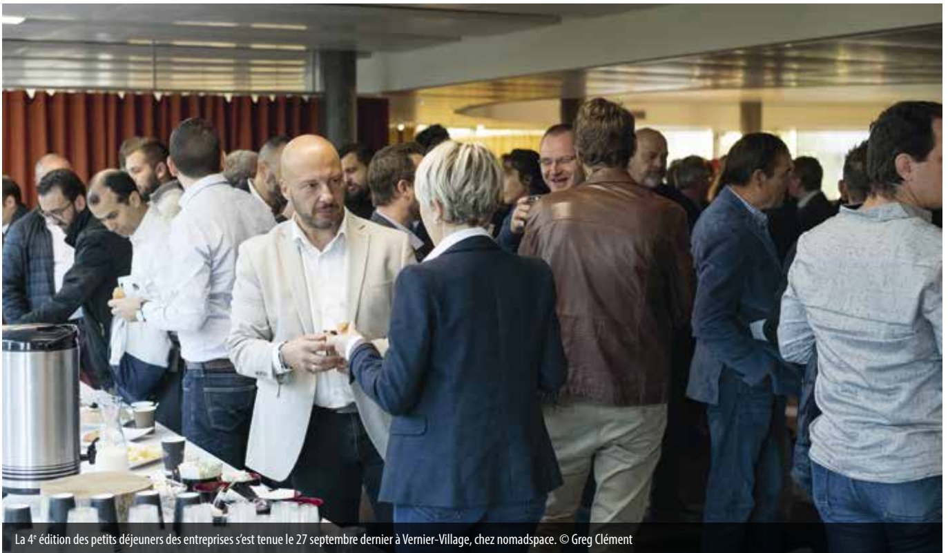
La 4 e édition des petits déjeuners des entreprises s'est tenue le 27 septembre dernier à Vernier-Village, chez nomadspace.