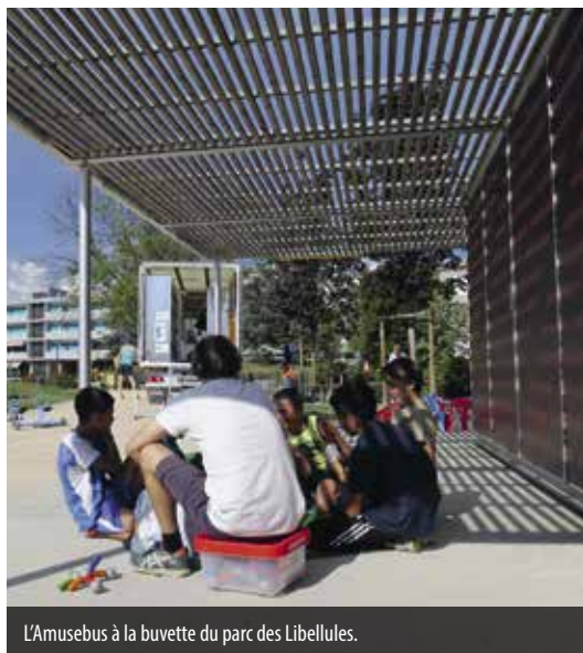
L'Amusebus à la buvette du parc des Libellules.

La délégation à la jeunesse a proposé aux habitantes et habitants de la ville de Vernier des jeux en libre accès dans les parcs et les préaux d'école durant tout l'été.