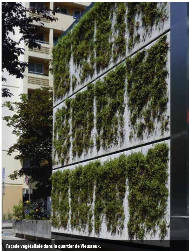
Façade végétalisée dans le quartier de Vieusseux.

Le socialiste Martin Staub (S) se dit sensible au problème du climat mais s'étonne du chiffre avancé dans la motion. Selon le texte, le plan climat doit se fixer « un objectif de 1000m 2 de surface de béton/goudron/pavés au moins par législature qui doivent être convertis en surfaces perméables », à savoir des surfaces qui accumulent moins de chaleur en période de canicule, comme les surfaces herbeuses. « Comment savoir si l'objectif chiffré de 1000m 2 est suffisant, est-ce trop ou trop peu ? », s'interroge l'élu socialiste. Johann Martens (S) relève que les sols minéraux, comme les revêtements phonoabsorbants, sont noirs et ont tendance à accumuler la chaleur. Le libéral-radical, Gilles Bron