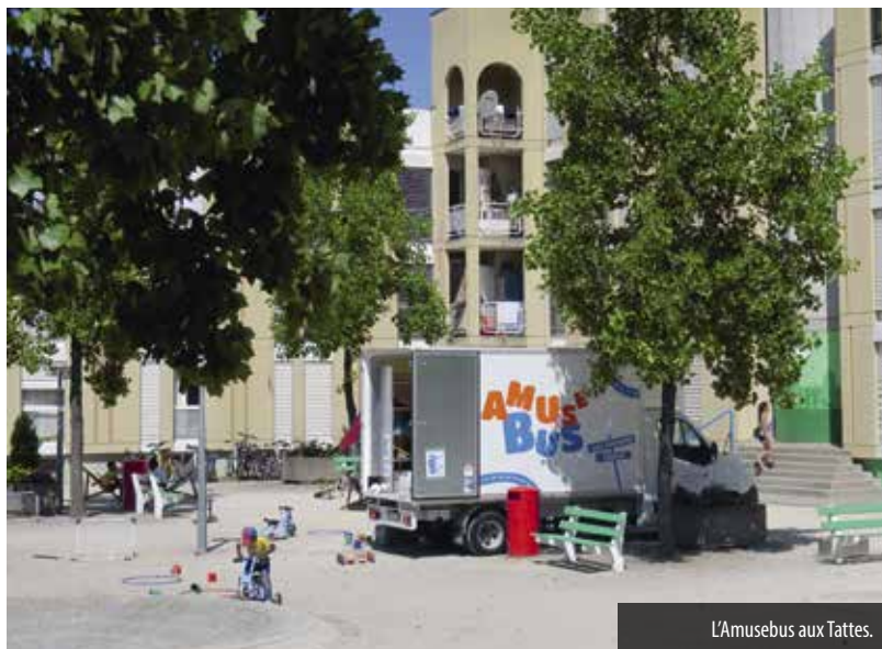
L'Amusebus aux Tattes.

L' Amusebus, véhicule rempli de jeux et de jouets, a sillonné durant les après-midis de juin à septembre les quartiers de Vernier à la rencontre des petits et des grands enfants souhaitant profiter de leurs vacances pour s'adonner aux activités ludiques en plein air proposées par l'équipe d'animation.