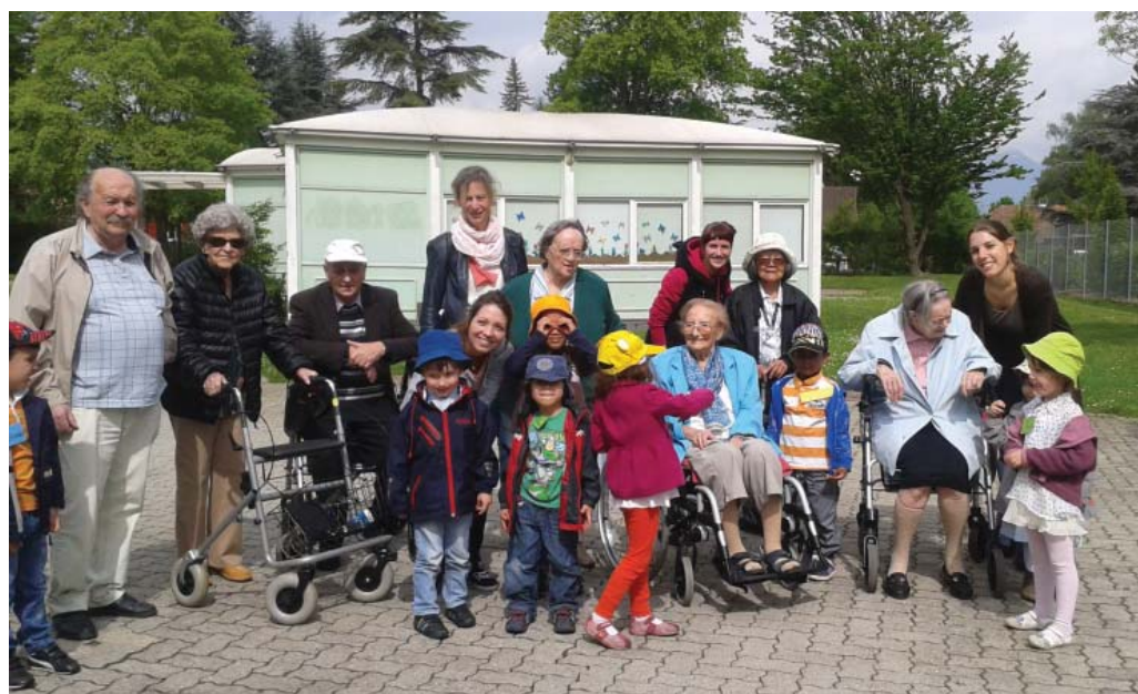
Les enfants accompagnent les personnes âgées à l'EMS.

Depuis mars 2013, des rencontres régulières ont lieu entre l'espace de vie infantile des Avanchets et l'EMS Pierre de la fée en alternance dans les structures. Des échanges qui permettent à chacune de découvrir le lieu de vie de l'autre.