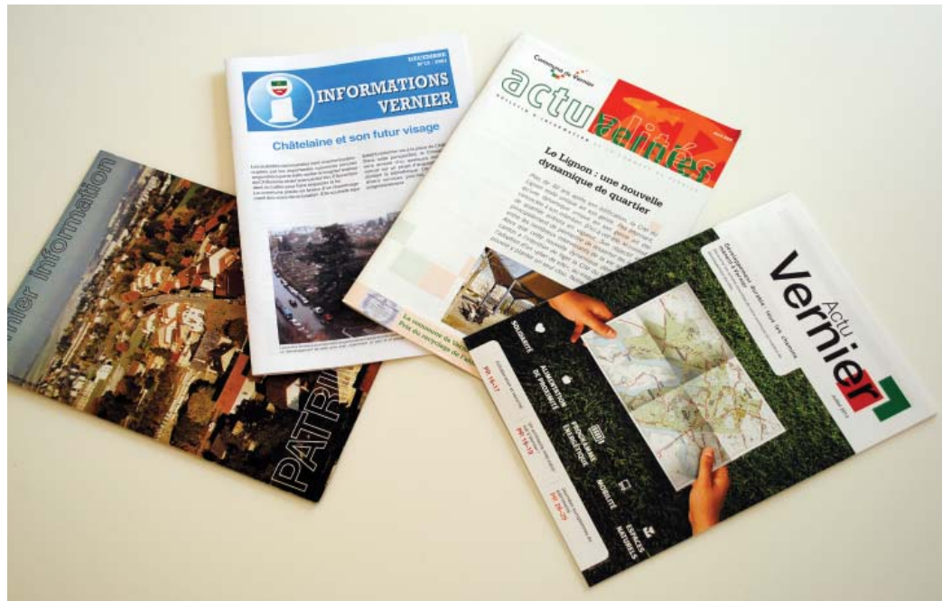
Les archives du journal communal sont accessibles sur www.vernier.ch

recevez ? | Cette question est une préoccupation centrale pour la Ville de Vernier. Au sein de son administration, un groupe de projet s'est nouvellement créé, composé de quatre personnes représentant des services communaux différents. Au cœur de cette démarche, un objectif commun : travailler sur les moyens possibles pour faciliter l'accès aux informations et aux prestations délivrées par la municipalité.