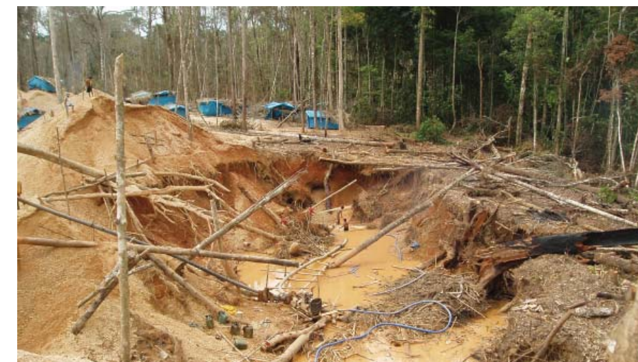
Mine d'extraction d'or (contenu dans les téléphones) où des enfants sont victimes d'exploitation.

* Swico Recycling est un système national, à but non lucratif, organisant le recyclage des appareils électriques et électroniques.