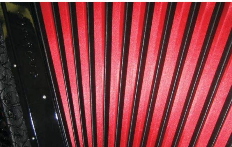
Soufflet du bayan, ou accordéon chromatique, qui est utilisé pour interpréter aussi bien de la musique classique que de la musique contemporaine.

tél. 022 782 05 89, president@accordeon-avenir.ch www.accordeon-avenir.ch