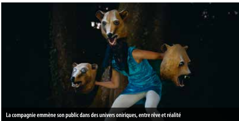
La compagnie emmène son public dans des univers oniriques, entre rêve et réalité