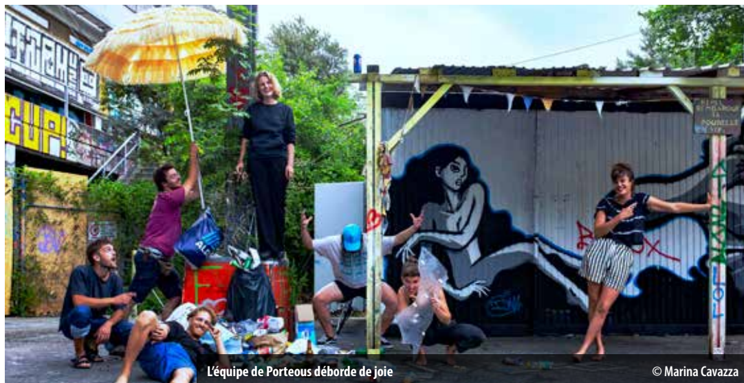
L'équipe de Porteous déborde de joie

L'association concentre ses efforts sur la préparation du futur chantier et continue à voguer sur le Rhône.