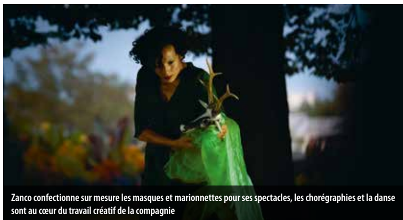
Zanco confectionne sur mesure les masques et marionnettes pour ses spectacles, les chorégraphies et la danse sont au cœur du travail créatif de la compagnie