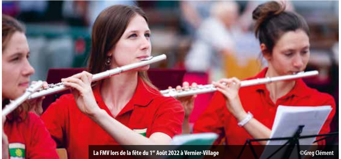
La FMV lors de la fête du 1 er Août 2022 à Vernier-Village