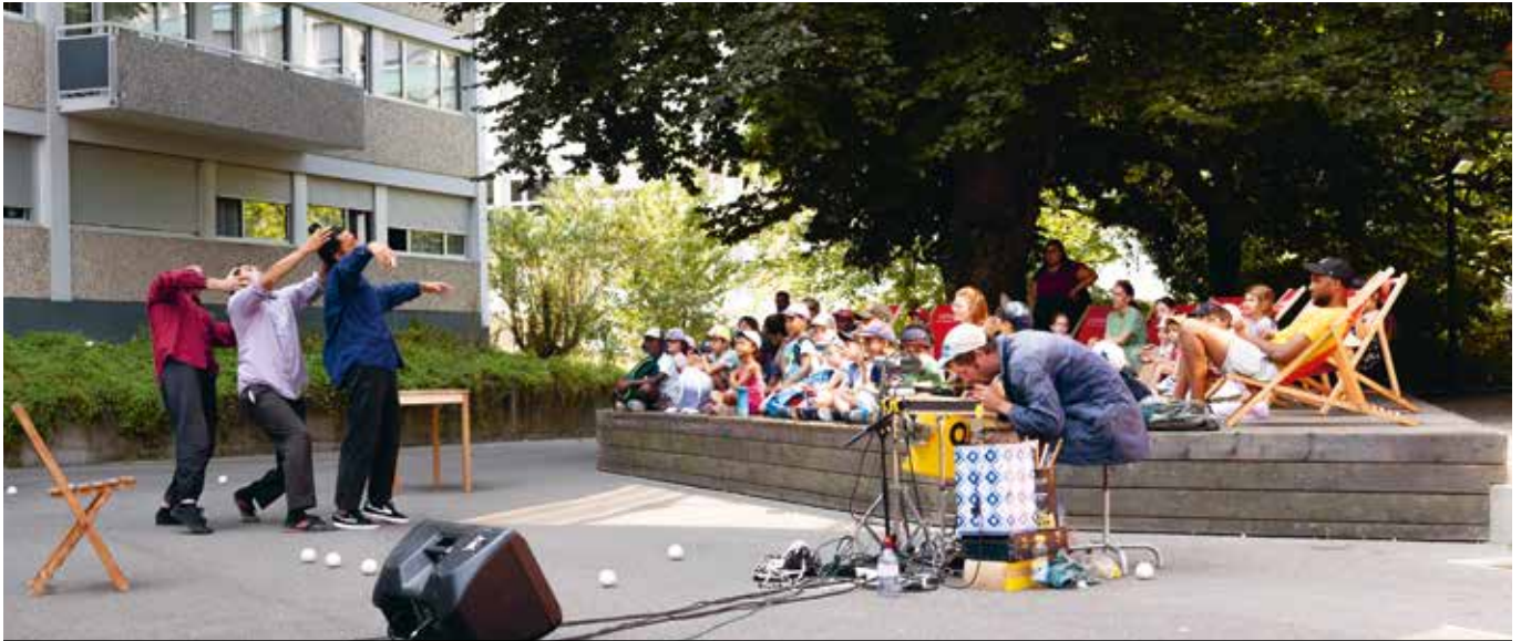
Et si ça tombe ? par le Collectif Acrocinus, une représentation dans le cadre de La ContreSaison 2022 sur la place de Châtelaine.

La Ville de Vernier s'engage pour garantir un accès facilité à la culture pour toutes et tous. Des nouveaux projets verront bientôt le jour dans différents quartiers de la commune.