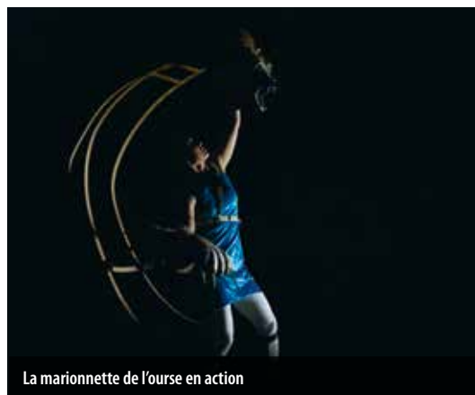
La marionnette de l'ourse en action