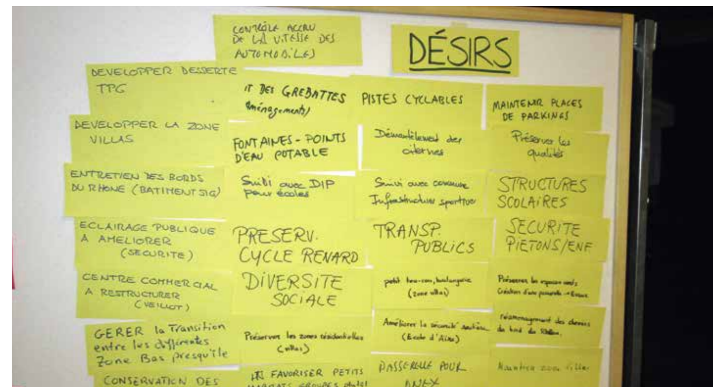
Liste des désirs pour le futur développement du territoire communal. Propositions formulées par la population dans le cadre des forums participatifs.

il faudra refuser tout développement supplémentaire et trouver des solutions. Le magistrat cite notamment «la couverture des voies de chemin de fer à Châtelaine, la diminution du nombre de citernes, ou encore le plafonnement des vols à Cointrin». La Commune continuera d'insister sur ces enjeux tant que les problématiques qui y sont liées ne seront pas résolues.