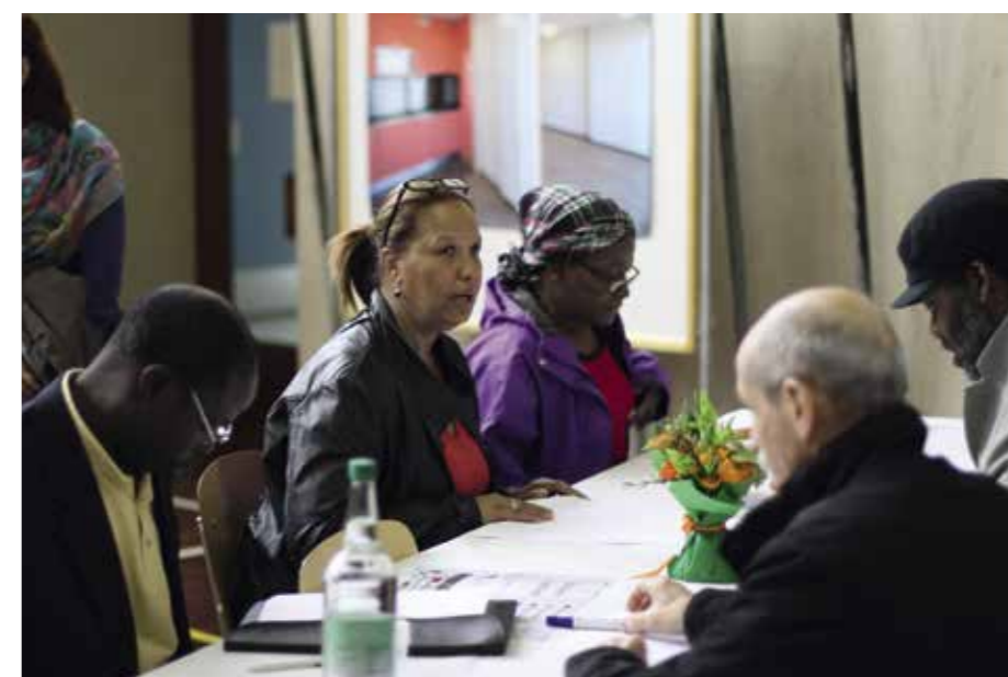
Forum participatif du 15 mars. Objectif : créer des projets pour faire vivre les dix espaces de vie des Libellules.

Les Nouvelles Libellules: un projet urbain pour « mieux vivre ensemble » | Les Libellules est le quartier le plus précarisé sur l'ensemble