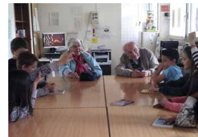
Rencontre Prix Chronos 2014 à l'école du Lignon.