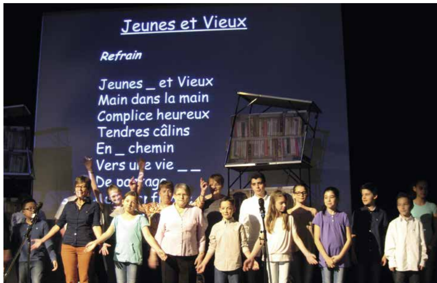
Remise du Prix Chronos 2015 au Salon du livre et de la presse de Genève 2015.

Le Prix Chronos de littérature a été créé en France en 1996 par la Fondation nationale de gérontologie. Dès 1997, Pro Senectute (fondation suisse présente dans tous les cantons) a repris le concept en Suisse. Il propose à des jeunes de 10 à 12 ans ainsi qu'à des seniors de lire cinq ouvrages ayant pour thèmes les relations entre les générations, la transmission du savoir, le parcours de vie, la vieillesse, etc. Après les cinq lectures, chacun vote pour son livre préféré et l'auteur gagnant est récompensé au printemps lors du Salon du livre et de la presse de Genève.