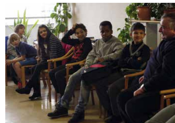
Rencontre Prix Chronos 2015 à l'immeuble d'encadrement pour personnes âgées du Lignon (imad).

La Ville de Vernier reconduit le projet de lecture intergénérationnelle pour les seniors et les jeunes qui le souhaitent. Les livres seront disponibles dès octobre 2015. Pour tous renseignements : service de la cohésion sociale, tél. 022 306 06 70, seniors@vernier.ch ou auprès des trois bibliothèques municipales : Châtelaine, tél. 022 306 07 97, Vernier, tél. 022 306 07 98, Avanchets, tél. 022 306 07 96.