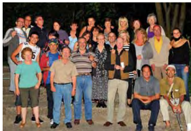
Le Lignon 82