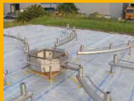
Le service des espaces verts a vérifié l'énorme réseau de tuyaux avant de l'installer sous les jeux à Balaxert. Un bac de rétention de 9'000 litres permettra de récupérer l'eau.