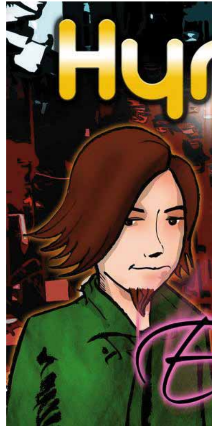
Pochette de l'album «Elle» de Hyren

Bastions. J'ai également été contacté par l'Office fédéral de lutte contre le SIDA pour jouer sur une grande scène à Berne. Le succès se construit petit à petit. A terme, je rêve de chanter à l'Olympia. C'est ma prière de tous les jours.» En attendant la célébrité, ce militant avéré continue son cheminement.