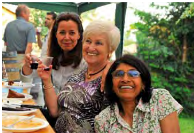
Route de Peney