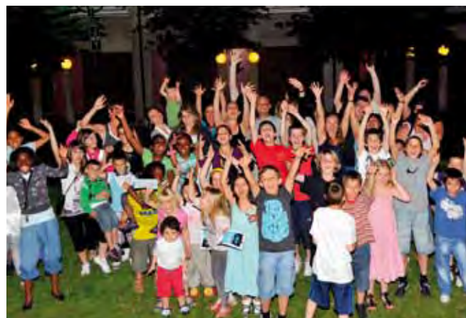
Chemin de Maisonneuve