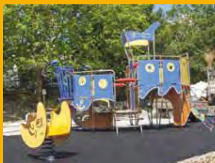
Le navire des pirates est bientôt prêt à appareiller !

L'association BricoJeune proposera de nombreuses animations ainsi que buvette et petite restauration pour faire la fête tard dans la nuit d'été.