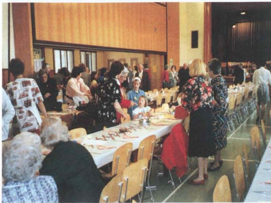
La Kermesse catholique du 28 avril 1996 à l'école de Vernier-Place

Ces deux emplacements ne sont pas loués pour des soirées dansantes ou des concerts. Pour ce type d'activités, Mme Meister Berthod dirige les personnes intéressées sur l'Eclipse (tél. 796 14 40), la Carambole (tél. 796 42 67) et les autres centres de loisirs.