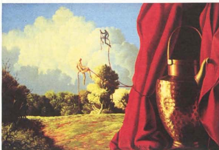
«PAESAGGIO con BROCCA DI RAME» (paysage avec broc de cuivre) huile sur bois 35 x 25 cm