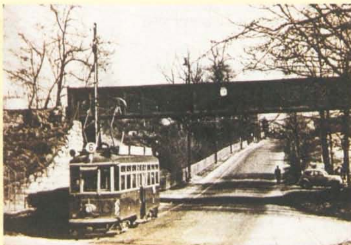
Entre Châtelaine et Vernier