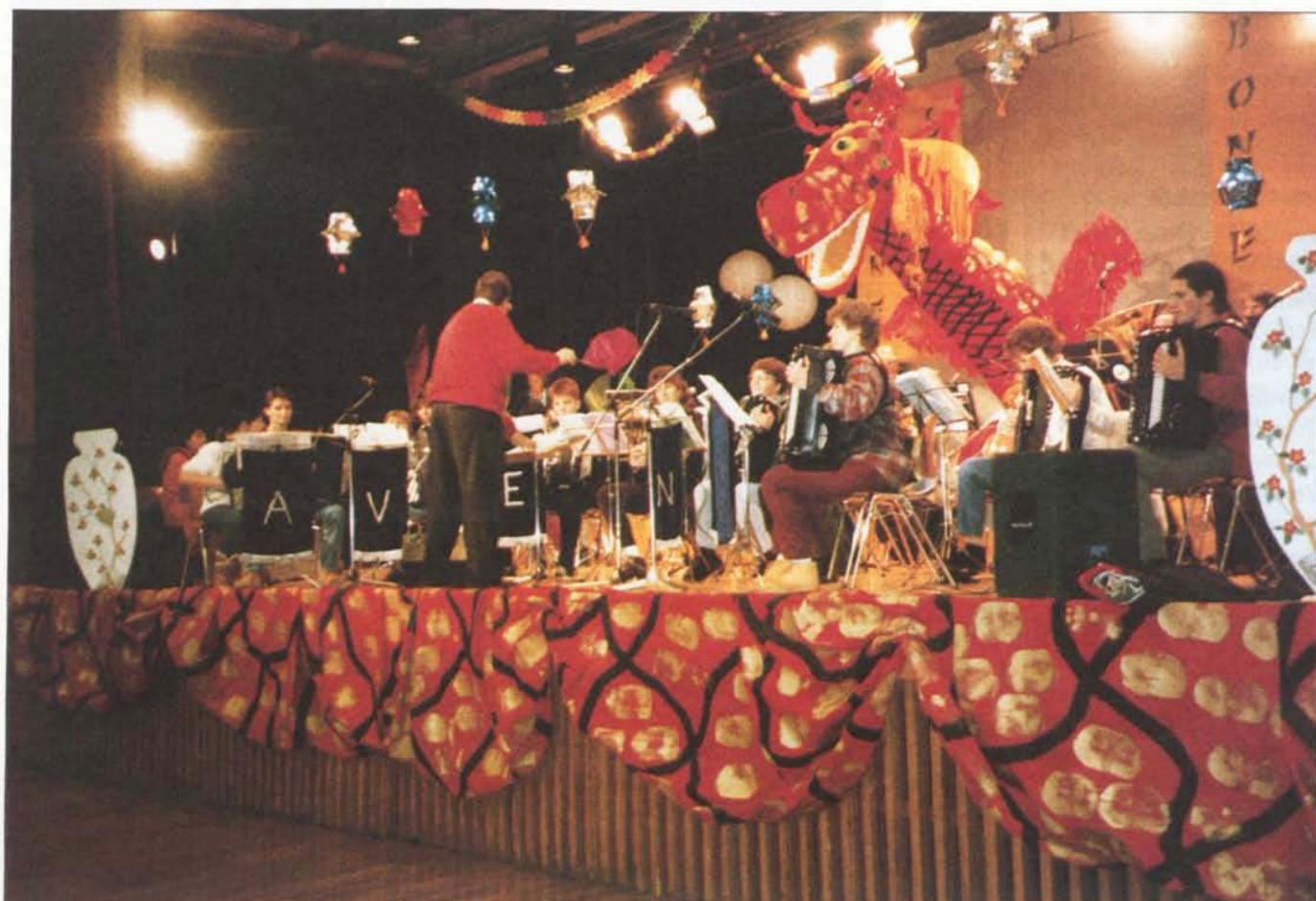
Morceau d'ensemble des accordéonistes de l'Avenir de Châtelaine et de la Fanfare municipale de Vernier sur la scène de la salle des fêtes du Lignon

Mais vu la quantité de requêtes qui lui sont adressées, elle a établi un règlement qui favorise les associations et sociétés locales.