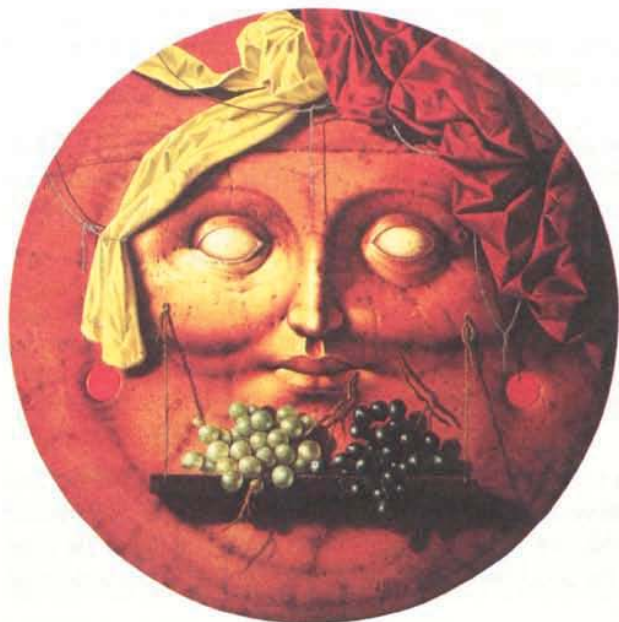
«COMPOSIZIONE con LUNA e UVA» (composition avec lune et raisin) huile sur bois 64,5 cm