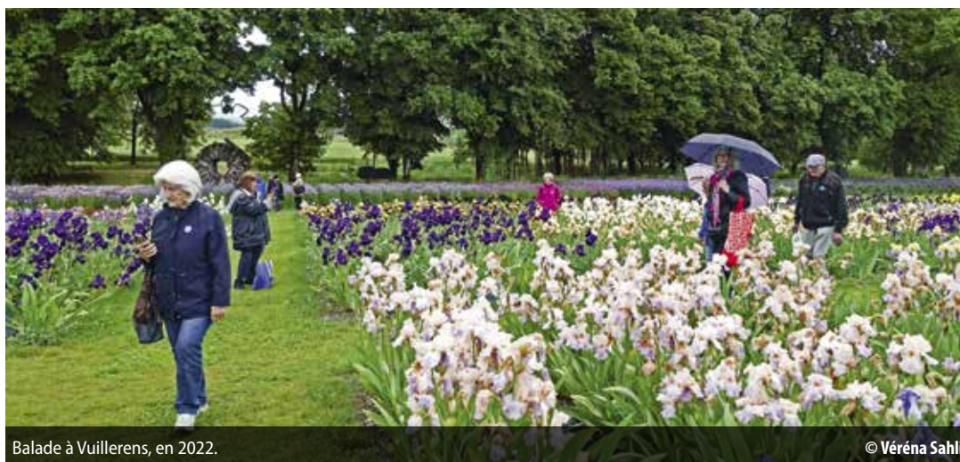
Balade à Vuillerens, en 2022.

Repas, sorties, films... Le Club d'Aînés de Vernier-Village bouillonne d'activités grâce à l'énergie de ses membres.