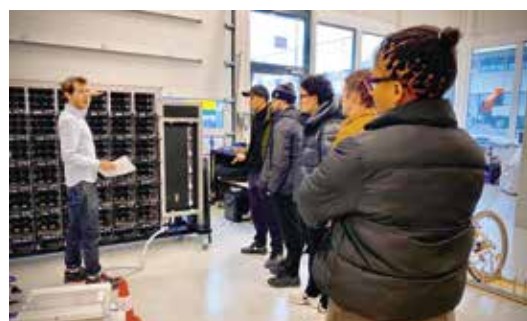
Visite de l'atelier.