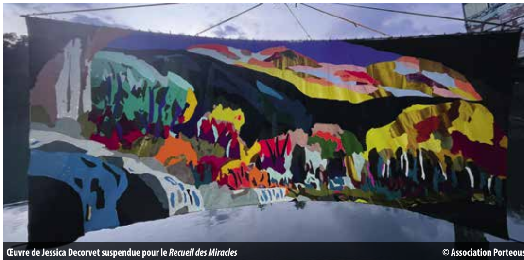
Œuvre de Jessica Decorvet suspendue pour le Recueil des Miracles

Un avant-goût de l'été: permanences et spectacle