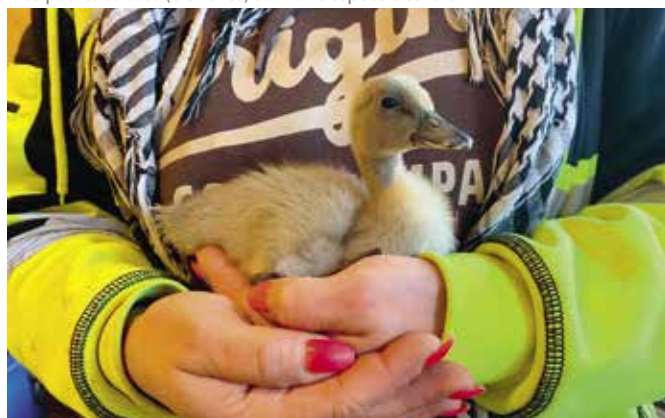
Le dernier-né de La Fermette : un caneton de Poméranie.