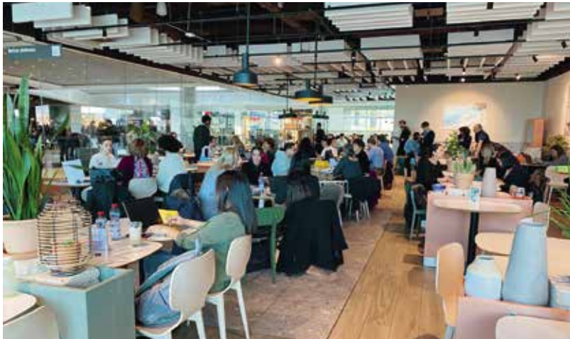
Le 4 février dernier, 17 entreprises ont répondu présent, 168 places d'apprentissage étaient proposées et 203 entretiens se sont tenus au cours de l'après-midi.

Le recrutement en direct permet aux jeunes de rencontrer des entreprises et d'accéder à l'apprentissage.