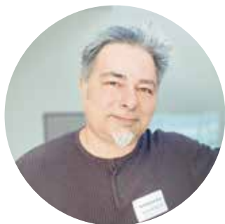
Sylvain Mossière © DR