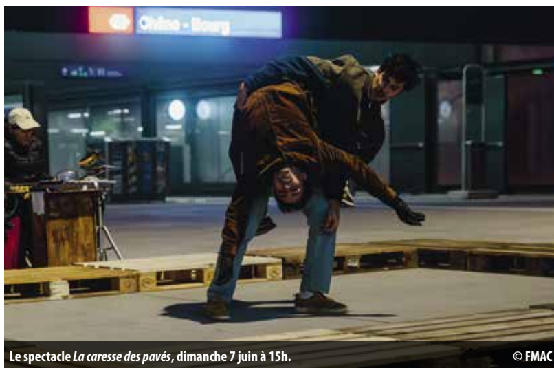
Le spectacle La caresse des pavés , dimanche 7 juin à 15h.

Les festivités se poursuivront ensuite à Meyrin, dans le quartier des Vergers, avec quatre autres propositions tout aussi festives et hautes en couleur.