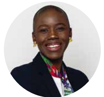
Nguirra De Torcy © SIG

Service de la cohésion sociale (SCS) www.vernier.ch/emploi-formation 022 306 06 70 – scs@vernier.ch