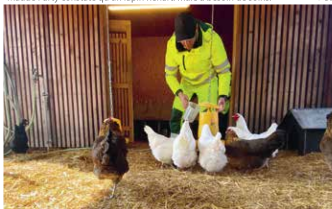
Les poules suisses (blanches) sont une espèce très rare.