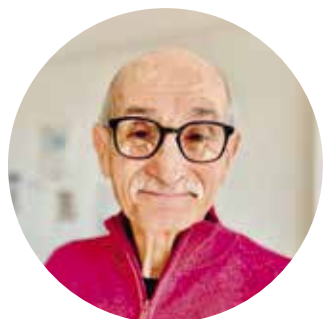
Aldo Cavagliotti © DR

Ces permanences offrent un pont permettant de franchir la fracture numérique, pas à pas, en toute sérénité. «Notre porte est ouverte, alors venez!»