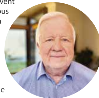
André Sahli

Osez franchir le pas ! Rejoindre le club, c'est l'occasion de tisser de nouveaux liens et de partager des moments conviviaux. Et si vous souhaitez aller plus loin, nous avons aussi besoin de coups de main. Pour nos repas, il faut préparer la salle, servir les plats cuisinés par notre traiteur, et gérer la vaisselle ainsi que le rangement aux Ranches : ce sont de beaux défis qui demandent de l'aide et de la bonne humeur. Nous recherchons également des volontaires pour épauler le comité d'ici 2027. Si vous avez envie de donner de votre temps, la porte est grande ouverte.