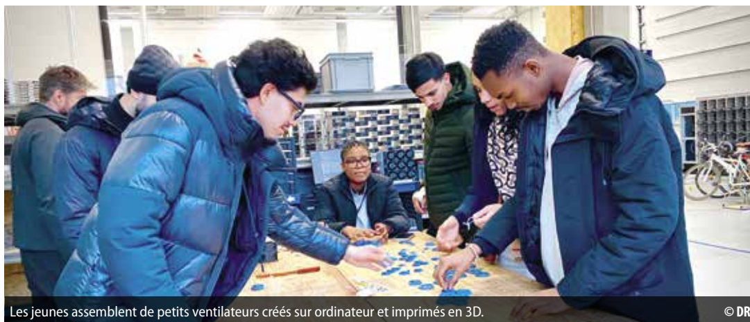
Les jeunes assemblent de petits ventilateurs créés sur ordinateur et imprimés en 3D.

Ateliers, immersions en entreprise et accompagnement personnalisé: le projet Envol permet aux jeunes de mieux cerner leurs envies, de découvrir des métiers, et de se projeter dans l'avenir.