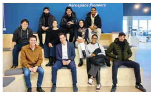
Photo de groupe.