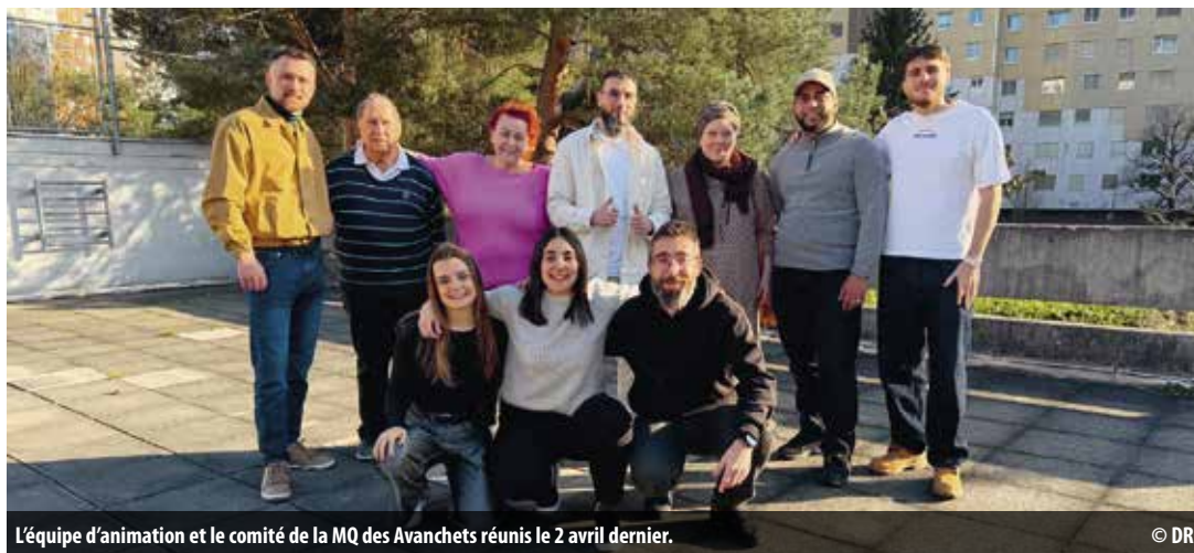
L'équipe d'animation et le comité de la MQ des Avanchets réunis le 2 avril dernier.

Portée par une nouvelle équipe d'animation en place et un comité engagé, la MQAV ouvre de nouveaux horizons avec et pour les habitantes et les habitants.