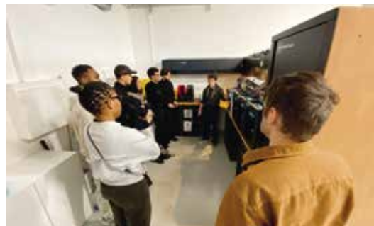
Découverte d'un logiciel et d'une imprimante 3D.