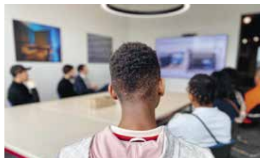
Présentation de l'entreprise.