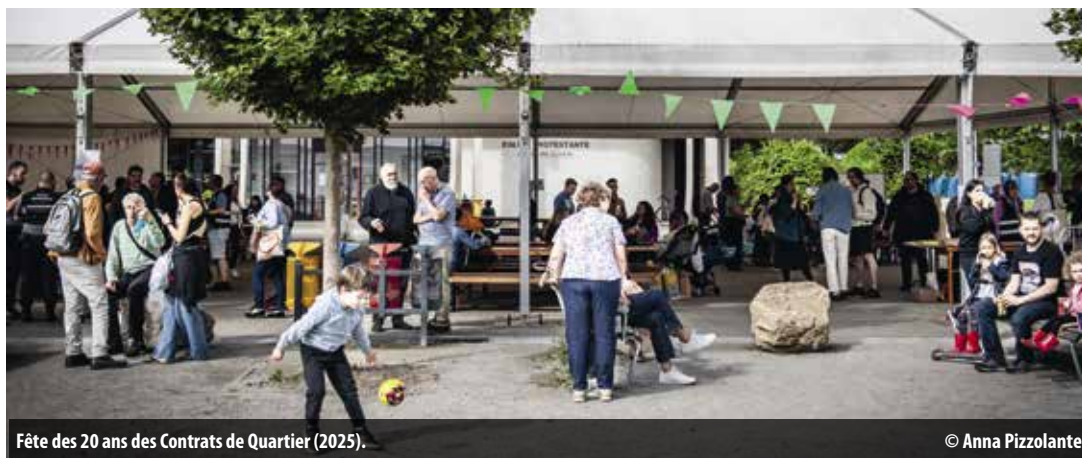
Fête des 20 ans des Contrats de Quartier (2025).

Samedi 30 mai, au parc de Balexert, les bénévoles des Contrats de Quartier vous invitent à découvrir des projets locaux et à partager un moment festif.