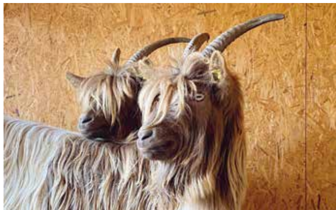
Gardien et Juju, deux des trois chèvres à Col fauve de La Fermette.

Service de l'environnement urbain (SEU) 022 306 07 00 – lafermette@vernier.ch