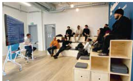
Introduction à la programmation avec le langage Python.