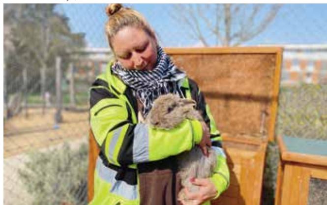
Maude Party constate qu'un lapin Renard mâle a besoin de soins.