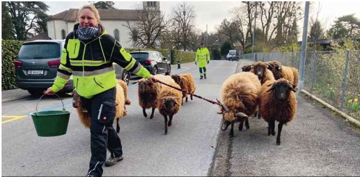
Les moutons Roux du Valais quittent La Fermette pour se rendre au parc de la Mairie où ils séjourneront une dizaine de jours, histoire de tondre l'herbe.

Clémentine est perchée sur son tronc d'arbre. James veille sur ses troupes. Saturnin trotte en attendant son repas. À La Fermette, chaque animal porte un nom, une histoire, et représente une race menacée à sauvegarder. Venez les découvrir !