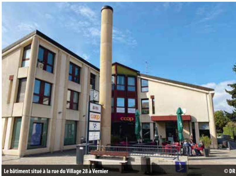
Le bâtiment situé à la rue du Village 28 à Vernier

Fondation des Maisons Communales de Vernier www.fmcv.ch