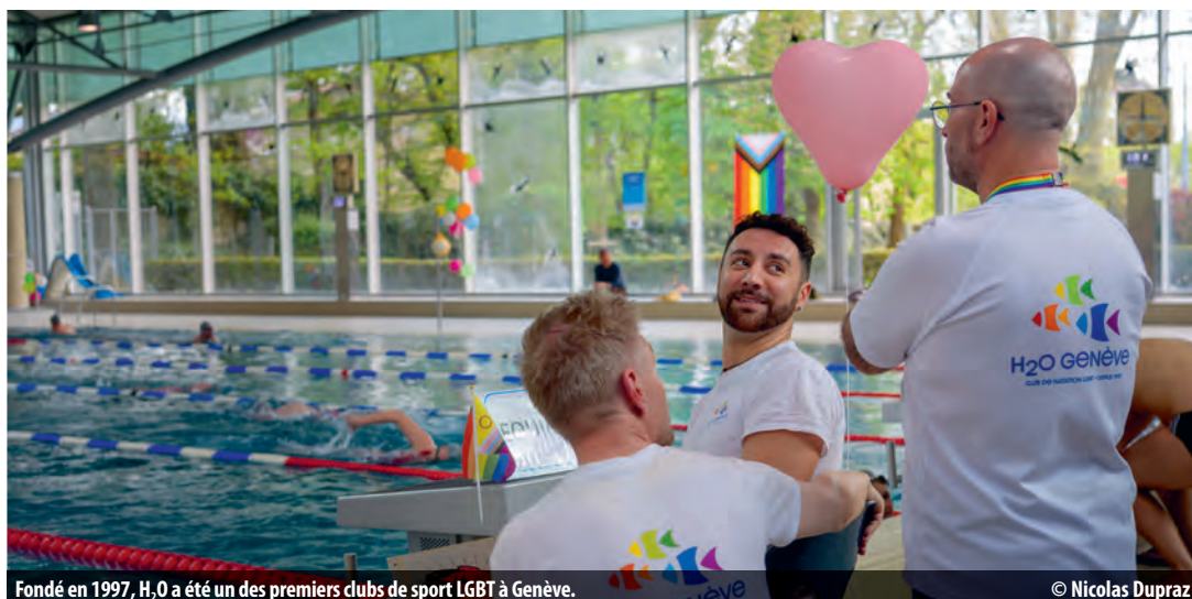
Fondé en 1997, H 2 O a été un des premiers clubs de sport LGBT à Genève.