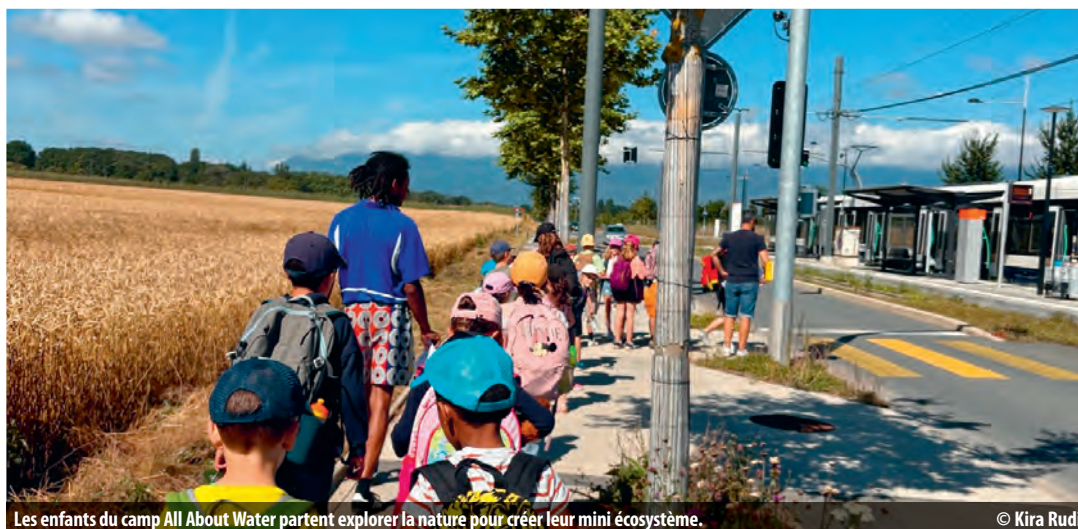
Les enfants du camp All About Water partent explorer la nature pour créer leur mini écosystème.

Le centre aéré All About Water invite les enfants verniolans à deux semaines de découvertes ludiques autour du thème de l'eau.