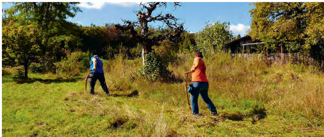
Chaque année, les bénévoles du verger fauchent la prairie.

L'ancien jardin abrite de nombreux arbres fruitiers. Les volontaires participent notamment à la fauche des hautes herbes, à la taille des branches et à la cueillette des fruits.