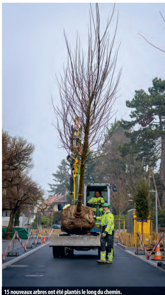
15 nouveaux arbres ont été plantés le long du chemin.

Service de l'aménagement (SAM) 022 306 07 40 – sam@vernier.ch