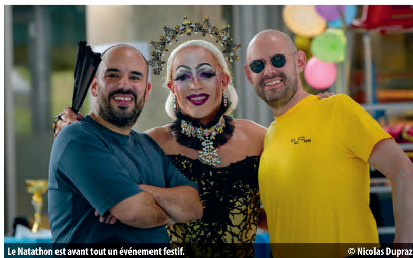
Le Natathon est avant tout un événement festif.