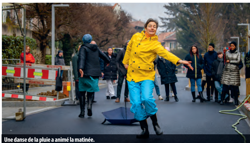
Une danse de la pluie a animé la matinée.