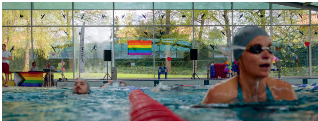
Au total, 93'000 mètres ont été parcourus à la brasse, en crawl ou sur le dos en trois petites heures.

Le 12 avril, une cinquantaine de nageurs et nageuses ont récolté quelque CHF 6000.– pour deux associations solidaires, lors du 4 e Natathon de Vernier.