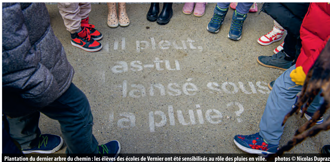
Plantation du dernier arbre du chemin : les élèves des écoles de Vernier ont été sensibilisés au rôle des pluies en ville.

Plusieurs aménagements ont été réalisés pour diminuer la chaleur emmagasinée sur cette artère de Vernier durant la belle saison.