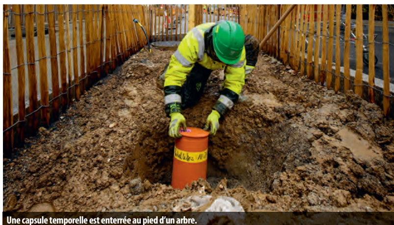
Une capsule temporelle est enterrée au pied d'un arbre.