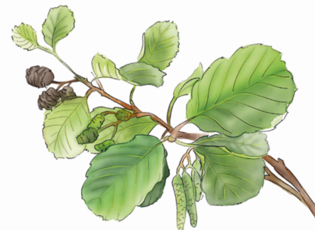
Aulne glutineux (Verne)

La Ville de Vernier tient son nom de la « verne », autre nom de l'aulne, un arbre répandu sur notre commune, car il pousse près des cours d'eau et des zones humides.