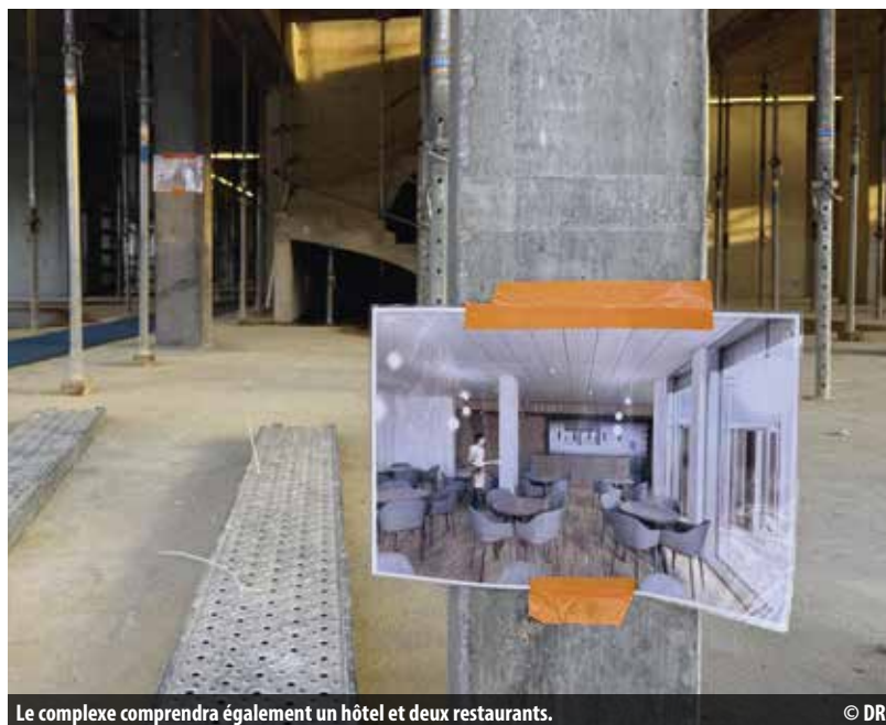
Le complexe comprendra également un hôtel et deux restaurants.

Le complexe accueillera par ailleurs tous les élèves du CFC danse. Il hébergera également le Conservatoire populaire de musique, de danse et de théâtre, l'Orchestre de Chambre