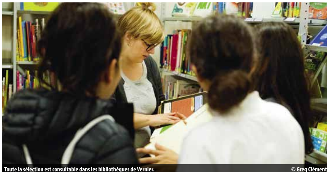
Toute la sélection est consultable dans les bibliothèques de Vernier.

En juin, chaque année, les élèves de 8P ont droit à un dictionnaire ou un livre et un calepin offerts par la Ville de Vernier pour marquer la fin de l'école primaire. Découvrez la sélection des bibliothécaires.