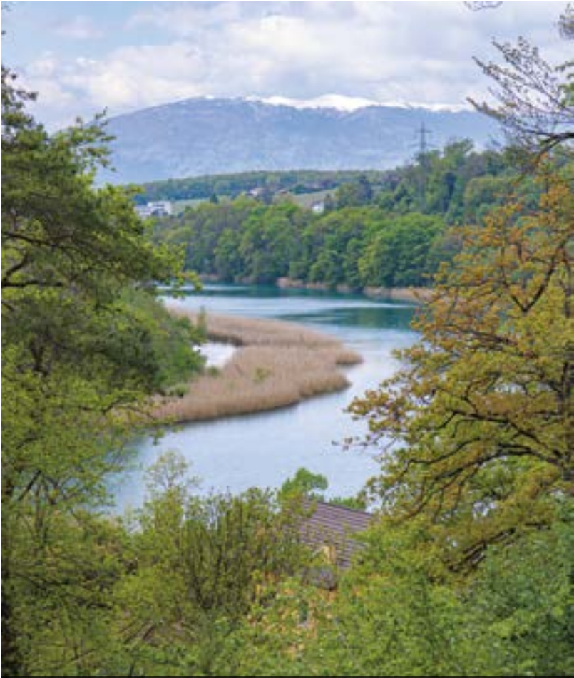
La réserve naturelle du Bois de la Grille abrite une faune et une flore particulièrement riches.

Pour les arbres, si les espèces indigènes sont toujours privilégiées, le choix se porte désormais aussi sur les essences d'Europe de l'Est. Ces variétés, habituées à un climat continental, supportent autant la canicule que le froid mordant. Des exemples? Le micocoulier, le chêne vert, le chêne chevelu ou encore le cèdre. Au niveau des massifs, les plantes annuelles sont progressivement remplacées par des vivaces, moins gourmandes en eau et à la durée de vie plus longue. Les jardiniers réfléchissent également à mettre en place un arrosage automatique « intelligent » qui tienne compte de la météo. Quant aux pelouses, à l'exception des parcs de Balexert, Chauvet-Lullin et de la Mairie, elles ne sont plus arrosées durant l'été pour limiter la consommation d'eau.