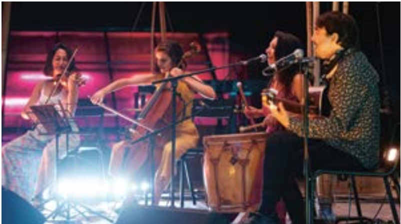
Barlovento Sur

Des spectacles gratuits à deux pas de chez vous !