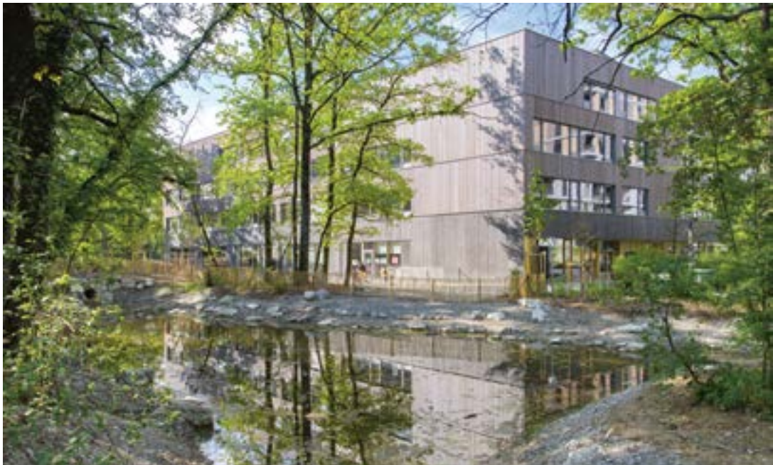
Dans le parc de l'Étang, la pièce d'eau a été entièrement réaménagée pour favoriser la biodiversité.

Le changement climatique et la pression démographique obligent les spécialistes de la nature en ville à adapter leurs pratiques. Qu'en est-il à Vernier ?