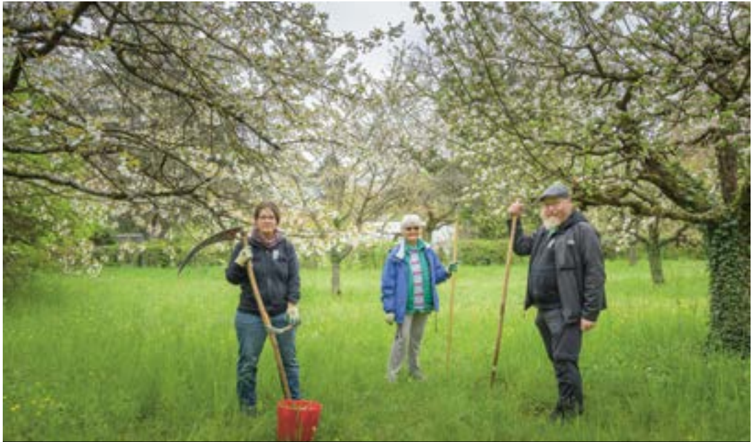
Le verger au Biolay compte plusieurs anciens arbres fruitiers. Il est géré depuis 2021 par une poignée de bénévoles.

Alors que la nature en ville évolue rapidement, chaque nouvelle mesure prise doit être accompagnée d’un travail de communication. «Il faut pouvoir expliquer pourquoi on ne procède plus comme on l’a toujours fait jusqu’à présent»,