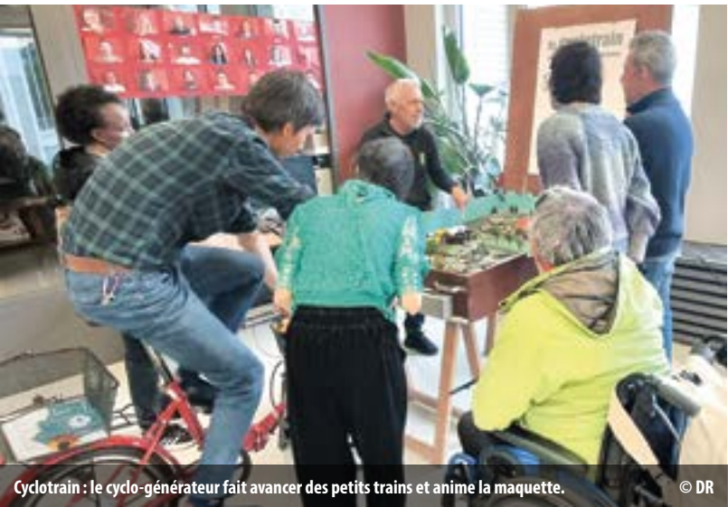
Cyclotrain : le cyclo-générateur fait avancer des petits trains et anime la maquette.

Contrat de Quartier Avanchets Tél. 077 474 68 04 – avanchets@cqvernier.ch www.vernier.ch/cq/avanchets