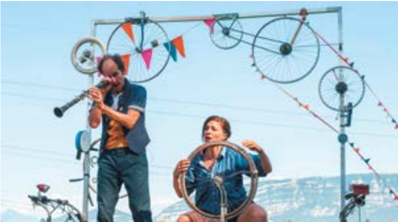
Engrenage, une histoire pour dépanner