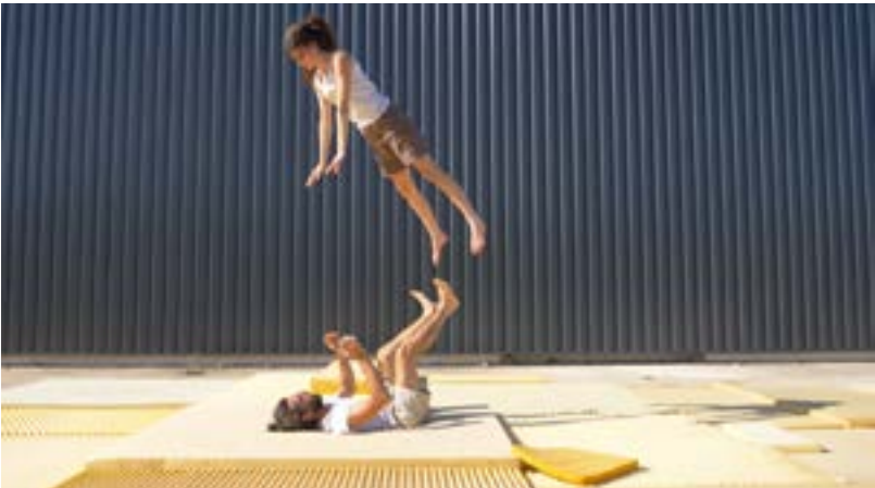
Nuée Ardente

Service de la culture et de la communication (SCC) Tél. 022 306 07 80 – scc@vernier.ch