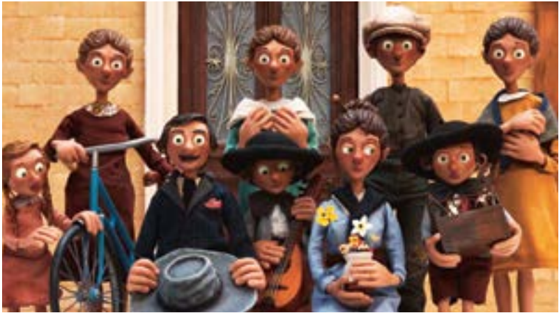
Interdit aux chiens et aux italiens