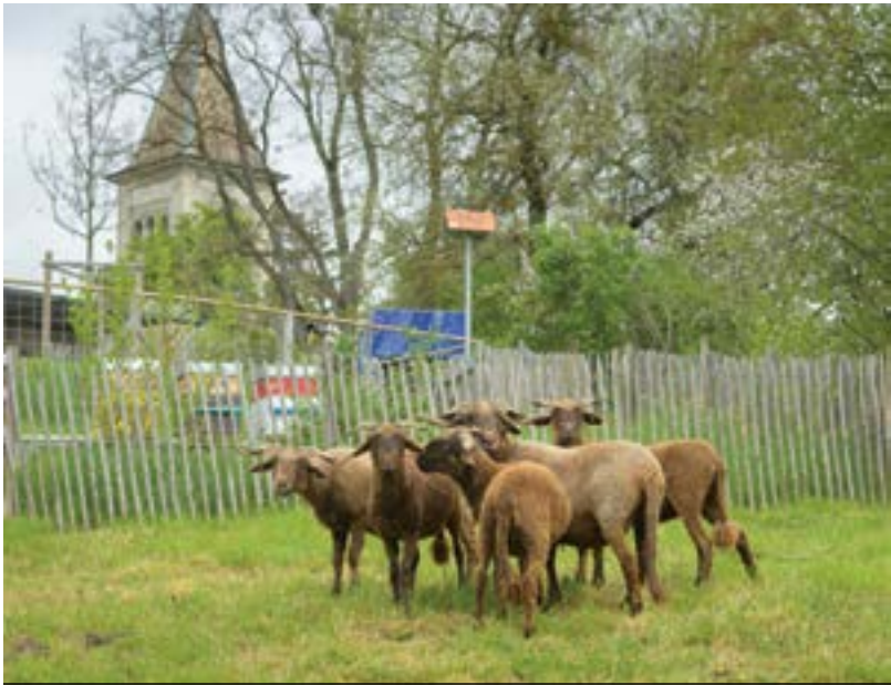
Les moutons du parc animalier de l’Esplanade sont utilisés pour tondre les surfaces herbeuses.

Service de l’environnement urbain (SEU) Via Monnet 3, 1214 Vernier Tél. 022 306 07 00 – seu@vernier.ch