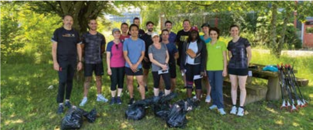
Munis de pinces et de gants, les participants ont réussi à collecter 4.9 kilos de déchets durant leur course à pied.

Les SIG en collaboration avec la Ville de Vernier ont organisé le 28 mai un «plogging», soit une course à pied combinée avec un ramassage des déchets.