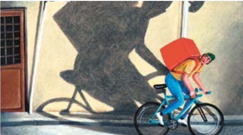
Cube! © Sylvie Wibaut

Tous les événements sont gratuits. Merci de respecter l’âge conseillé. Les ateliers sont accessibles à toutes et tous sans inscription. Les spectacles sont annulés en cas de mauvais temps.