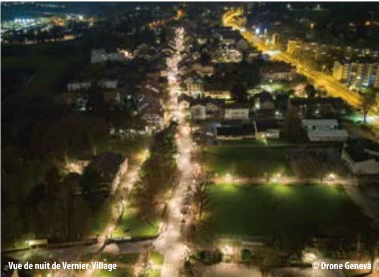
Vue de nuit de Vernier-Village

Lors de ces deux soirées, les participants parcourent à la nuit tombée un itinéraire choisi à travers le territoire verniolan, accompagnés des spécialistes qui recueillent leurs ressentis. À la suite de chaque soirée, une séance sera organisée le lendemain matin pour échanger de manière conviviale sur les ressentis des marches de la veille. La communauté contribue ainsi à la définition des grandes orientations du Plan lumière .