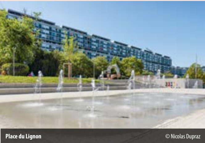
Place du Lignon

Les centres commerciaux , climatisés, peuvent aussi être une solution pour celles et ceux qui cherchent à se rafraîchir ; souvent aménagés d'espaces de repos et de bancs, ils peuvent être fréquentés sans obligation d'achat. Pour les personnes concernées, les lieux de culte (églises, temples, mosquées) sont souvent des environnements frais et ouverts dans lesquels il est possible de se recueillir à l'abri de la chaleur.