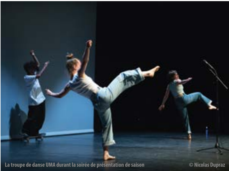
La troupe de danse UMA durant la soirée de présentation de saison

Service de la culture et de la communication (SCC) T. 022 306 07 80 – scc@vernier.ch