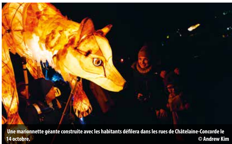
Une marionnette géante construite avec les habitants défilera dans les rues de Châtelaine-Concorde le 14 octobre.

Cie Zanco, Arcade des arts vivants Avenue de Châtelaine 77 www.zanco.ch – arcade@zanco.ch Instagram/Facebook @theatrezanco