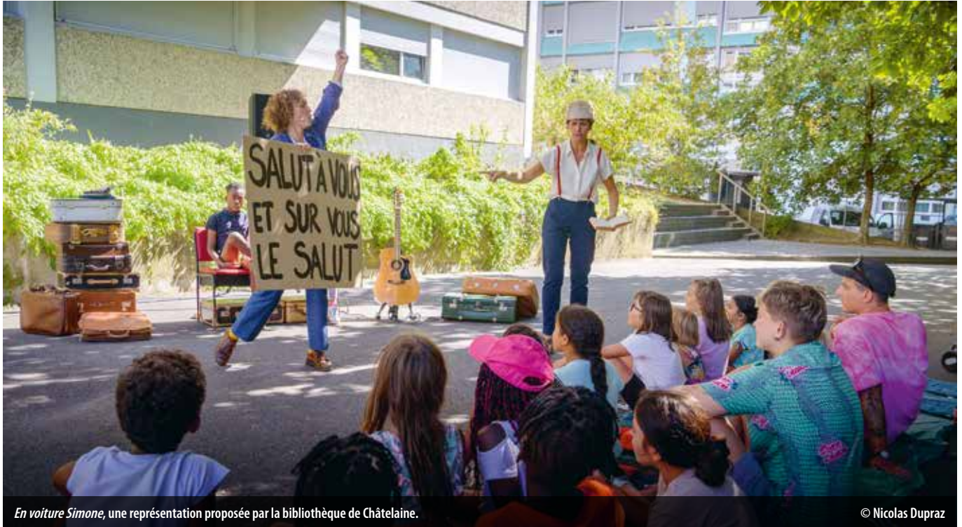
En voiture Simone, une représentation proposée par la bibliothèque de Châtelaine.