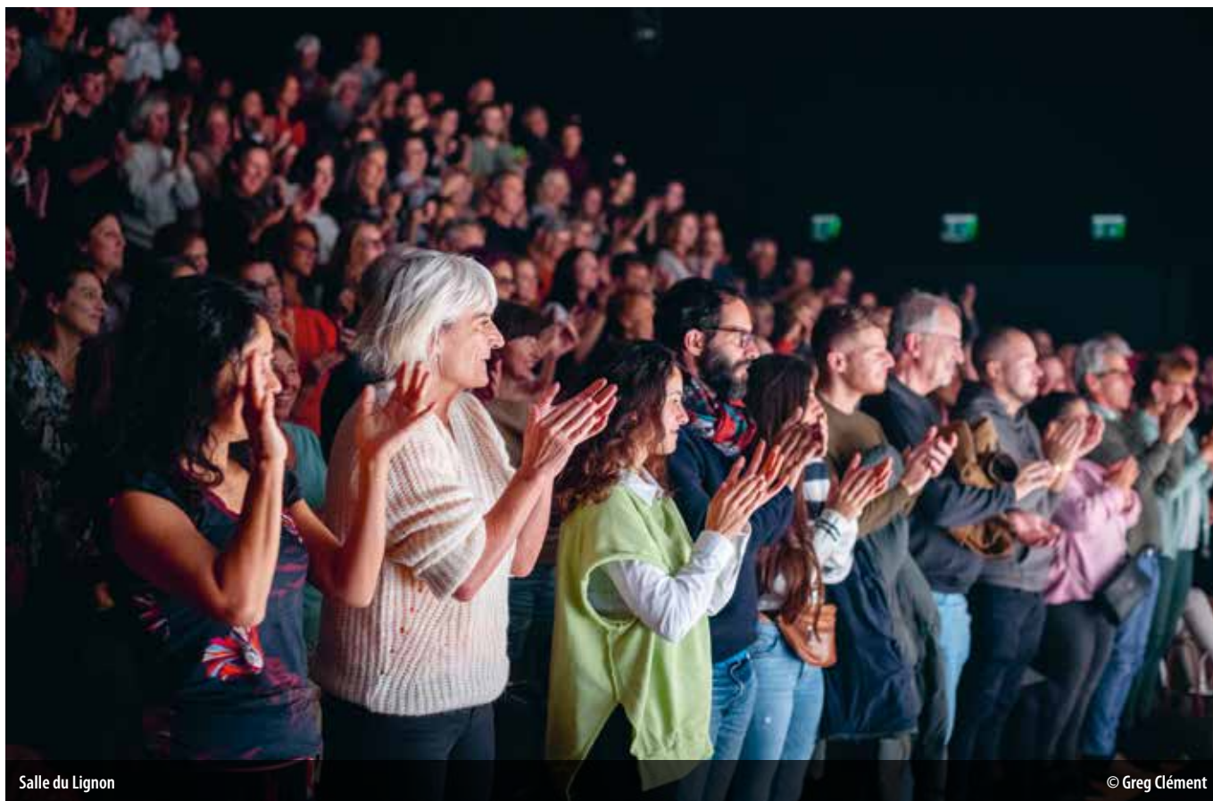
Salle du Lignon

De la Salle du Lignon aux trois bibliothèques communales, la culture se déploie aux quatre coins de Vernier. Tour d'horizon des rendez-vous à ne pas manquer.