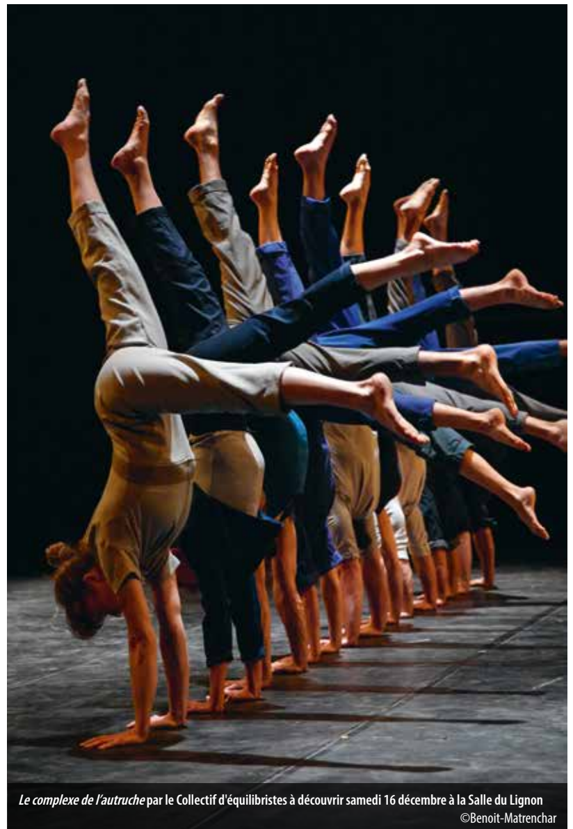
Le complexe de l'autruche par le Collectif d'équilibristes à découvrir samedi 16 décembre à la Salle du Lignon

Chaque semestre, quatre séances de 45 minutes à une heure sont organisées. Regroupant plusieurs courts-métrages autour d'une thématique générale, ces rendez-vous, agendés les mercredis à 15h, s'adressent à tous les publics dès 4 ans. Dans sa programmation qui s'étend de septembre à décembre, le Petit Black Movie accorde une large place aux films d'animations issus du monde entier. Certains films sans parole permettent au public non francophone de profiter également de cette offre. Les projections organisées par Filmar en America entre janvier et avril se concentrent, quant à elles, sur des films sud-américains.