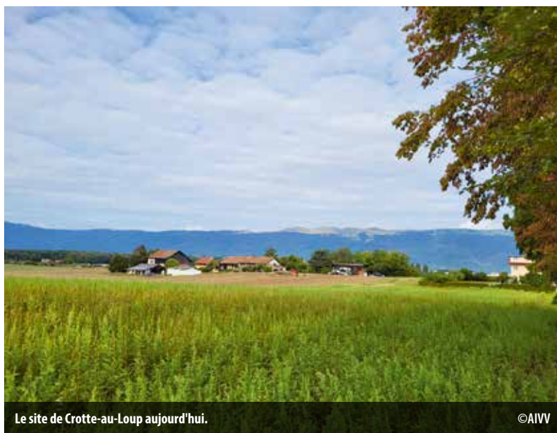
Le site de Crotte-au-Loup aujourd'hui.

C ontrairement au projet des Evaux, le Canton de Genève a informé les associations dès l'été 2022 de sa décision d'installer à Crotte-au-Loup les 5 terrains de foot et les infrastructures nécessaires à l'Académie du Servette.