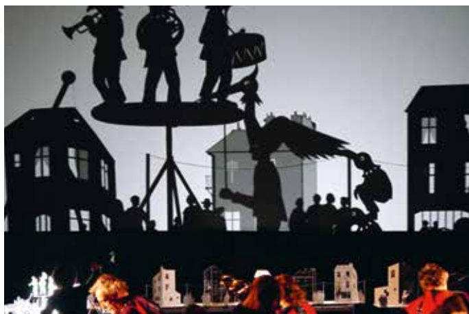
Les Ombres portées

Vernier Culture présente chaque année un programme artistique riche et varié à la Salle du Lignon. Découvrez les prochains spectacles !