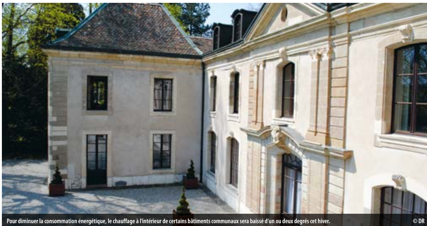
Pour diminuer la consommation énergétique, le chauffage à l'intérieur de certains bâtiments communaux sera baissé d'un ou deux degrés cet hiver.

Face à l'augmentation des coûts de l'énergie et aux potentielles difficultés d'approvisionnement, la Ville de Vernier met en place des mesures pour réduire la note et anticiper les risques de pénurie.