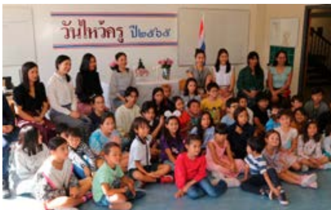
L'association accueille une cinquantaine d'élèves âgés de 4 à 15 ans.

L'association de langue et de culture thaïe est en lien avec le Bureau d'intégration des étrangers et le Département de l'instruction publique. Elle est soutenue par l'ambassade de Thaïlande située à Berne qui fournit le matériel d'appui logistique et d'apprentissage.