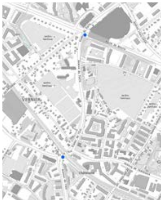
Localisation des pompes en libre-service.

Service de l'environnement urbain (SEU) seu@vernier.ch Tél. 022 306 07 00