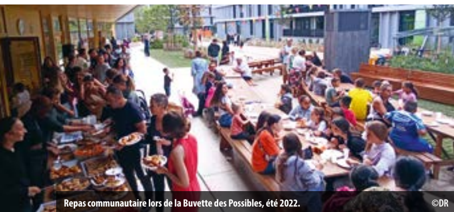
Repas communautaire lors de la Buvette des Possibles, été 2022.

Service de la cohésion sociale tél. 022 306 06 70 – participation@vernier.ch – www.vernier.ch/cq