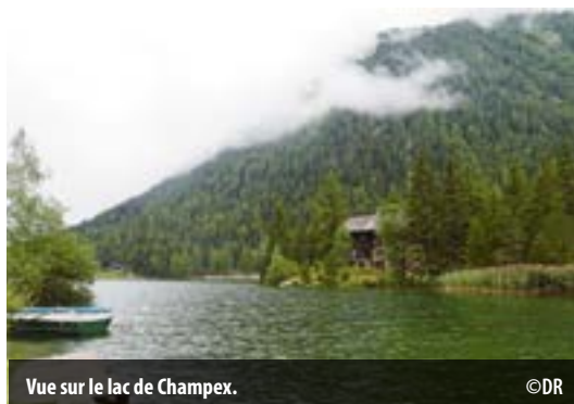
Vue sur le lac de Champex.

Service de la cohésion sociale, délégation aux seniors, tél. 022 306 06 70 – seniors@vernier.ch