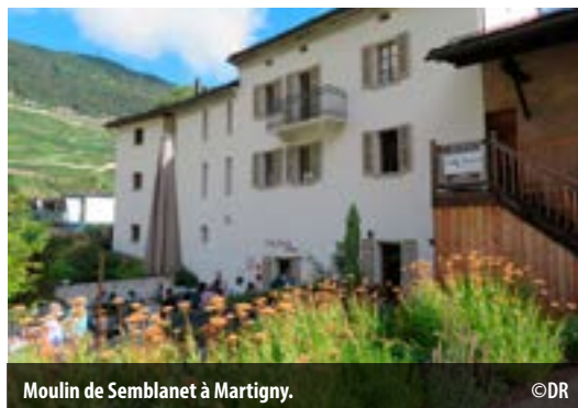
Moulin de Semblanet à Martigny.