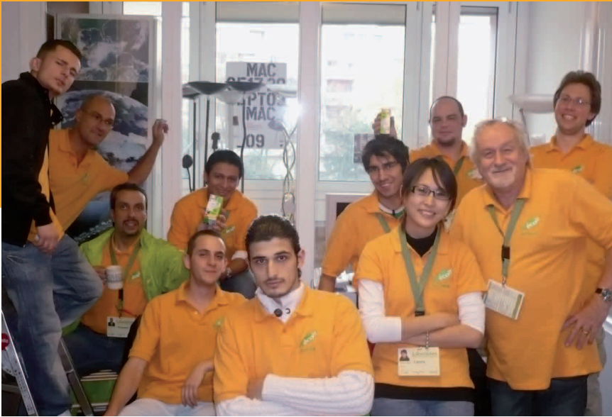
L'équipe des conseillers en énergie du quartier des Libellules.