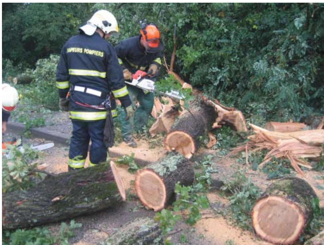
Déblaiement d'un arbre tombé sur la voie publique au Lignon