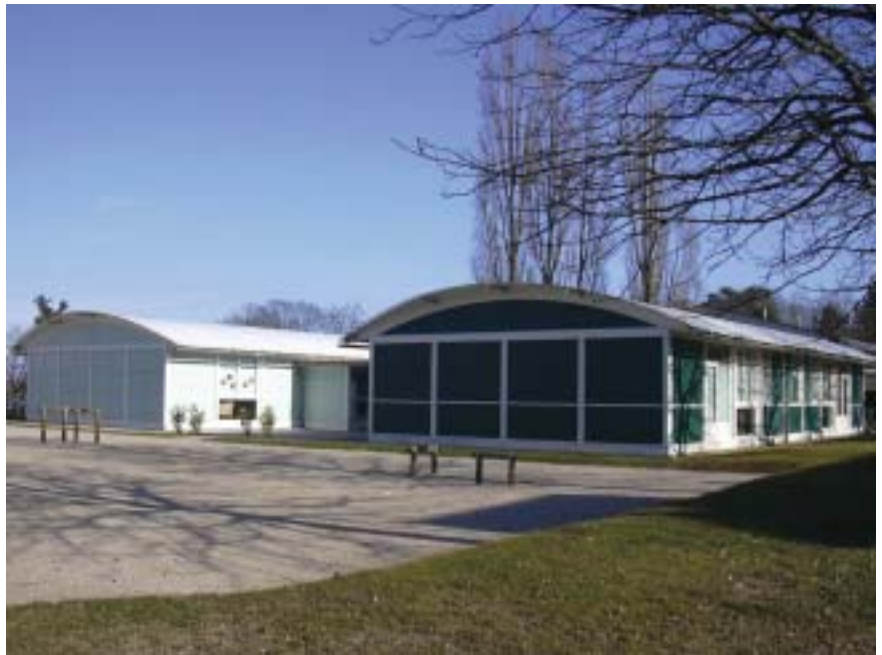
Les nouveaux locaux installés sur le terrain derrière la Poste de Vernier-village.

sés à l'école de Balexert, sur le site de l'école de Vernier.