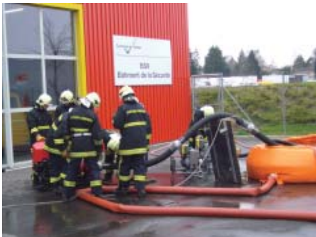
Un exercice motopompe devant le Bâtiment de la sécurité

Si le test est réussi, il faut suivre ensuite une école de formation: travail avec les tuyaux, avec les extincteurs, avec les échelles, avec la motopompe. Il y a aussi les cours de premier secours et de la théorie. Un examen de sortie