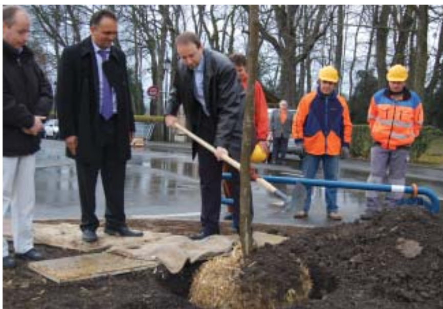
Thierry Apothéloz, Maire, donne le coup de pelle inaugural de la plantation de ces arbres d'un genre nouveau.