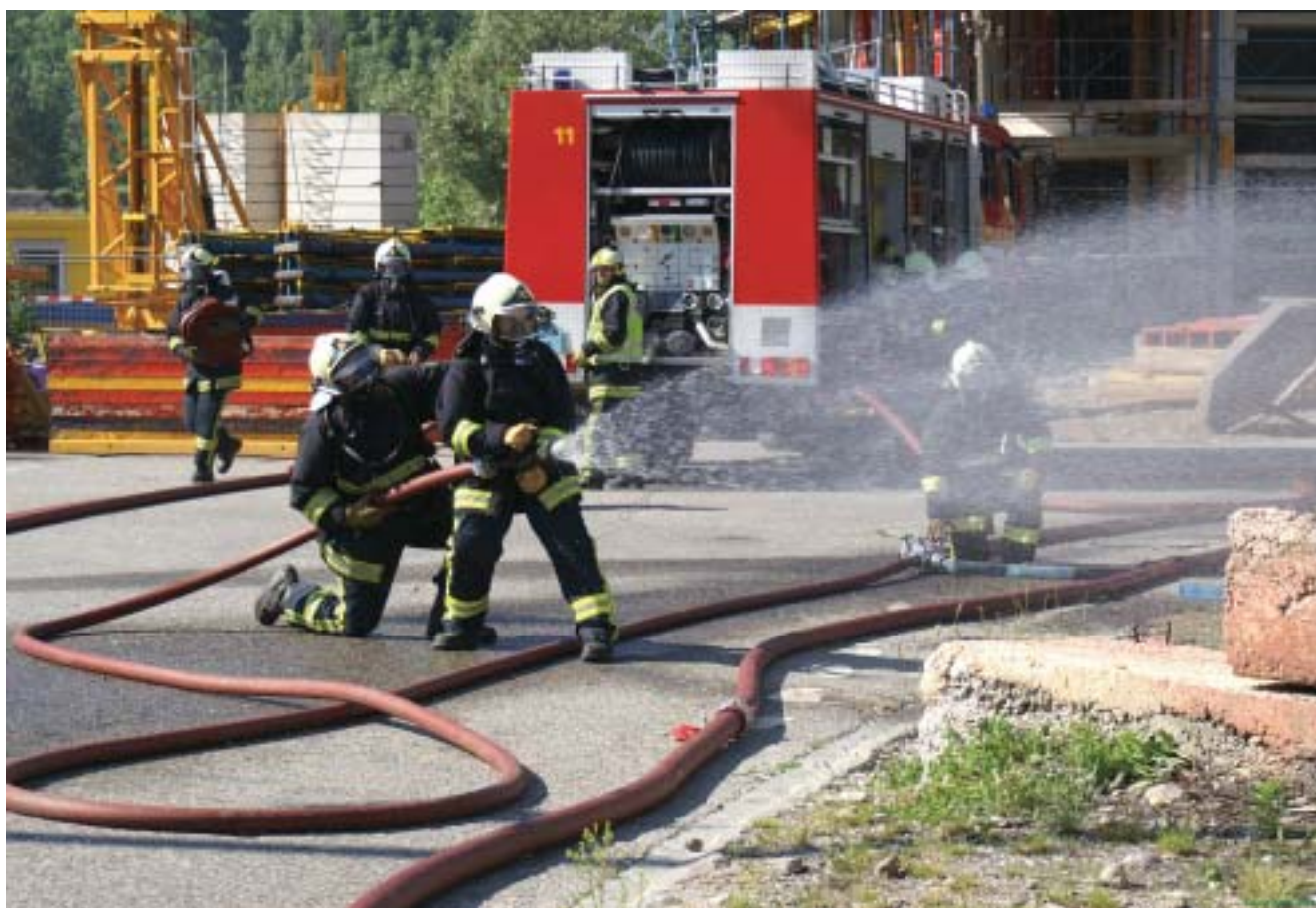
La Compagnie 51 en exercice sur la place d'armes d'Epeïsses.

A l'époque, lorsqu'il y avait une alarme incendie, le SIS se rendait sur place. Puis, d'après la gravité du sinistre, le SIS alarmait l'officier de la commune concernée, lequel se rendait aussi sur place. Lorsque ce dernier était sur les lieux du sinistre, il alarmait alors sa