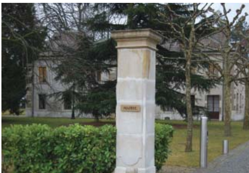
Les séances du municipal étant publiques, les portes de la mairie sont ouvertes les soirs des plénières.

Les représentants du Mouvement citoyens genevois boivent du petit lait.